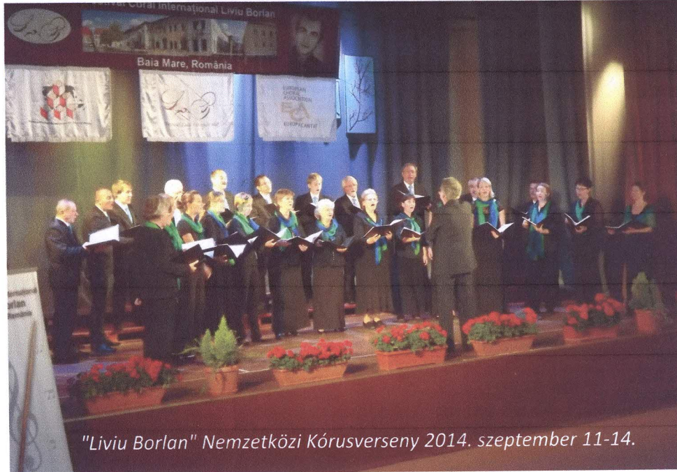
"Liviú Borlan" Nemzetközi Kórusverseny 2014. szeptember 11-14.

SZEKSZÁRDI MADRIGALKÓRUS EGYESÜLET 7100 Szekszárd, Flórián u. 5. Tel.: +3670-367-0178 szmadrigal@gmail.com