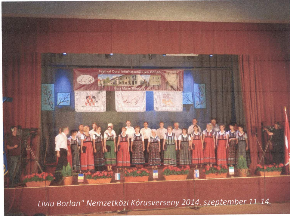
Liviu Borlan" Nemzetközi Kórusverseny 2014. szeptember 11-14.

SZEKSZÁRDI MADRIGÁLKÓRUS EGYESÜLET 7100 Szekszárd, Flórián u. 5. Tel.: +3670-367-0178 szmadrigal@gmail.com