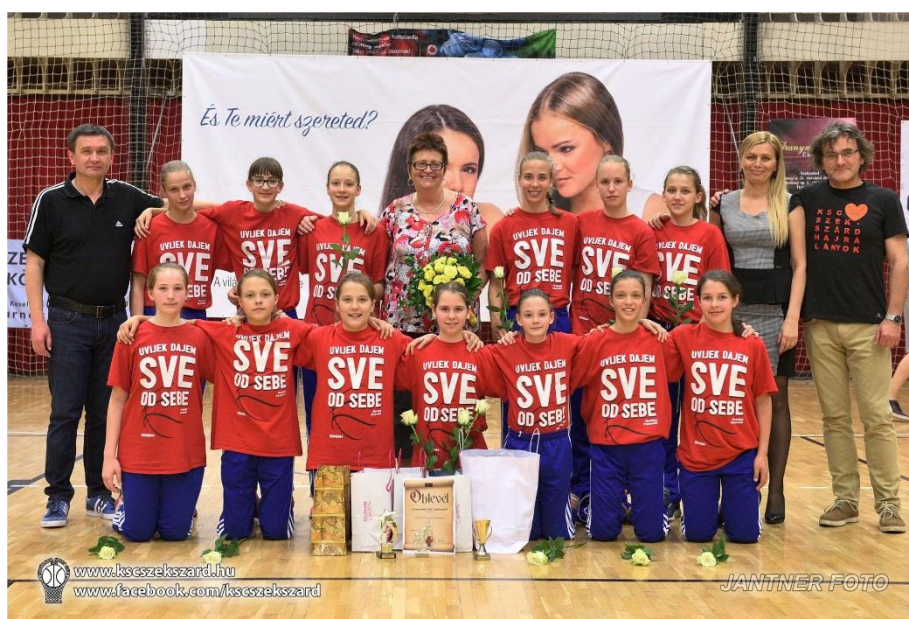
Atomerőmű KSC Szekszárd (U13 Országos Döntő 5. hely)