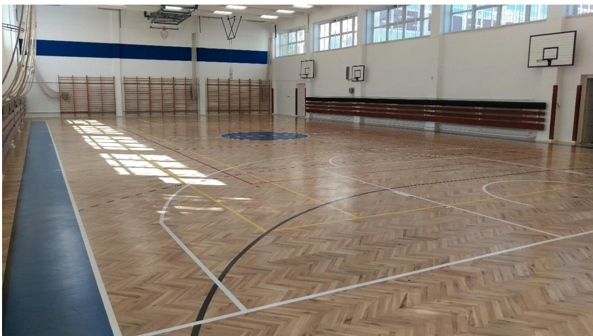
PTE-KPVK tornaterem 2016. augusztus 31.

Ide tartozik a PTE-KPVK tornaterme és öltözői valamint vizesblokkjai. Ebből a projectből a csapatok és az intézmény hallgatóinak zavartalan felkészülését, oktatását szem előtt tartva előfinanszírozással a nyáron elkészült a tornaterem teljes körű felújítása.