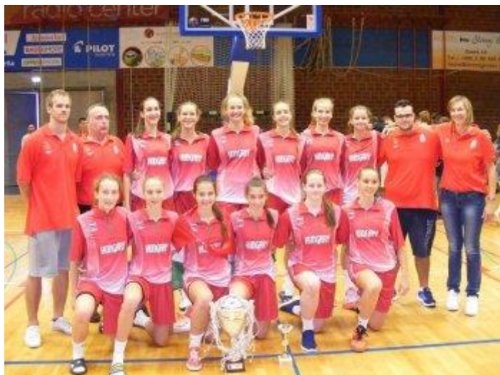
U14-es leány válogatottunk Szlovéniában

A tornán a magyar és a spanyol lányok is veretlenül jutottak el az utolsó napig, így ezen az összecsapáson már a tornagyőzelem volt a tét. A hatalmas küzdelmet hozó találkozón Salamon Endre tanítványai drámai végjáték után 43-42-re diadalmaskodtak, amellyel megszerezték az első helyet.