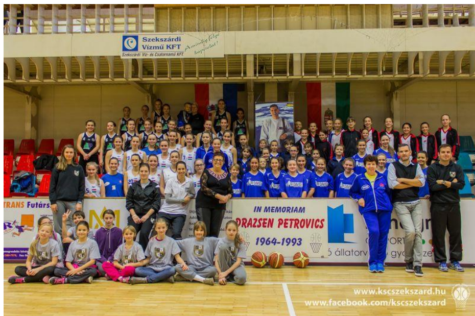
XXII. Drazen Petrovic Emléktorna (2015. október 14.)

Idén sem maradhat el a már hagyományossá vált Drazen Petrovic Emléktorna (2016. október 23., Szekszárd), amely egy napos rendezvényként népszerűsíti a városban a kosárlabdát. Az előző évekhez hasonlóan a torna több korosztályos mérkőzést, dobóversenyt és emlékműsort is tartogat a kilátogatók számára.