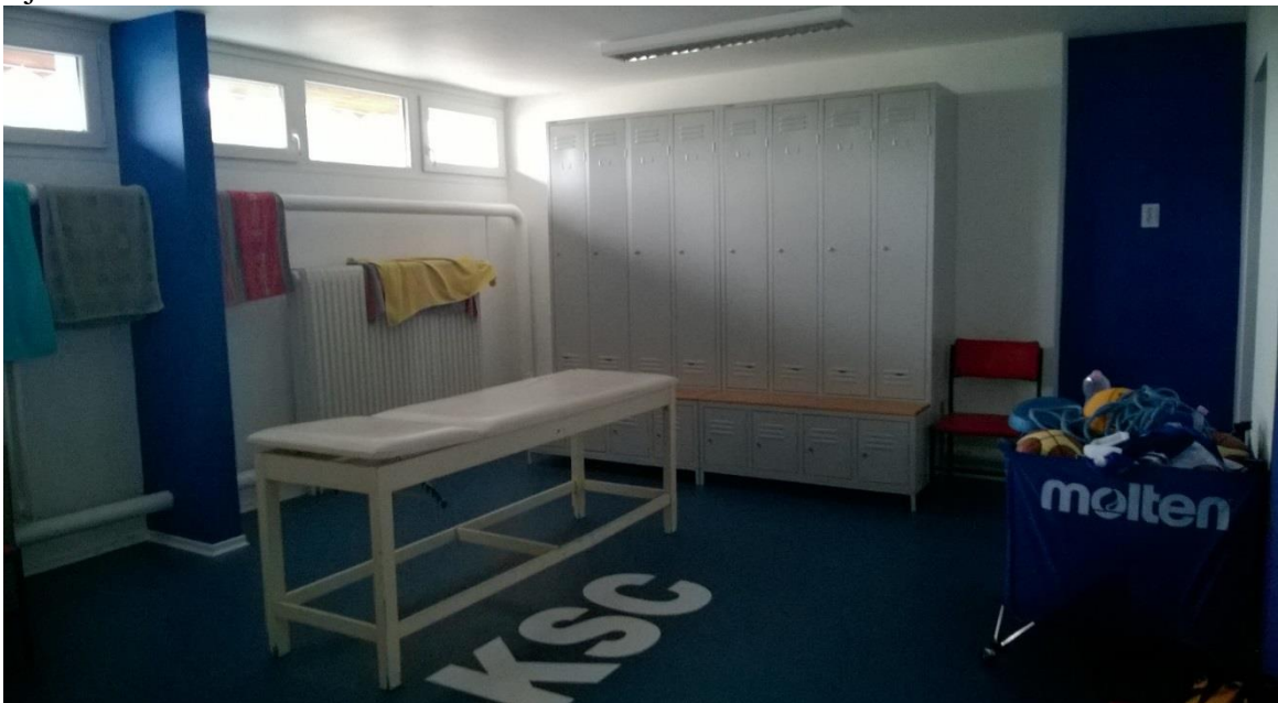
Szekszárd Városi Sportcsarnok 5. sz. öltöző

Sportfejlesztési programunk további részeként 3 MFt összértékben teljes körű felújításra került a Szekszárd Városi Sportcsarnok 5. sz. öltözője és a hozzá tartozó vizesblokk. Az érintett öltözőt kizárólag egyesületünk csapatai használják, így az edzésekkel és mérkőzésekkel kapcsolatos öltözőkódás és tisztálkodás korszerű, modern környezetben zajlik.