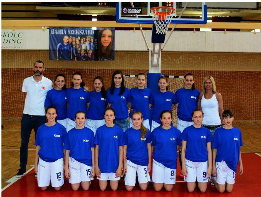
Atomerőmű KSC Szekszárd (U15 Országos Döntő 5. hely)