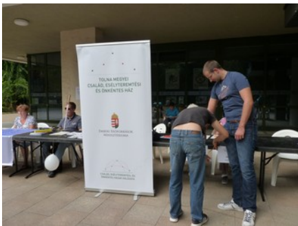
Az egész napos