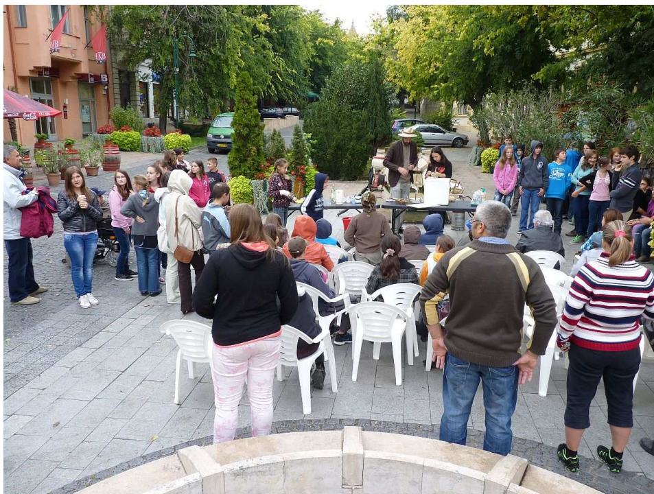
Kis Kutatók Délutánja