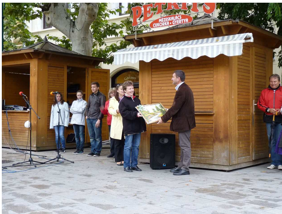
Év Képviselője 2013 Díjátadó