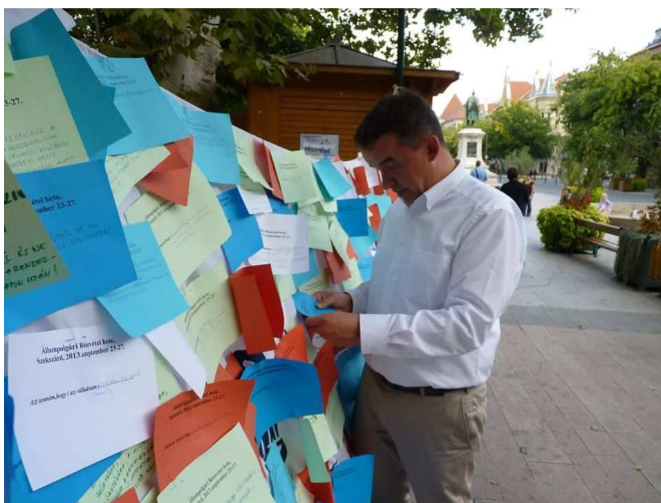
Polgármester úr kíváncsi a véleményekre