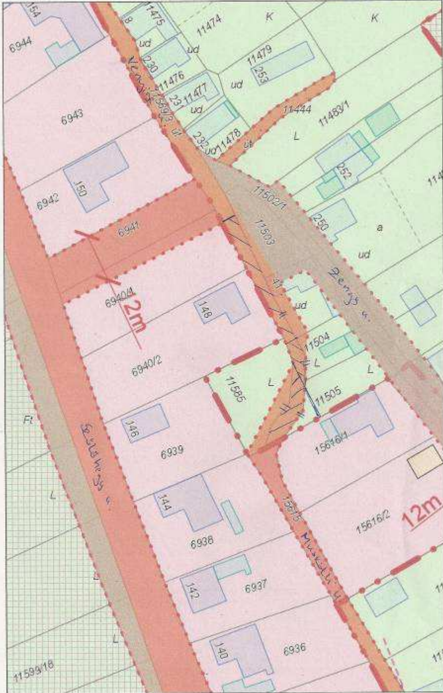
2014.5.27, Szekszárd, M = 1:750