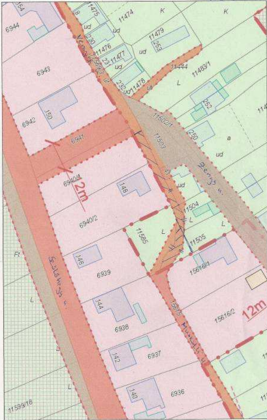
2014.5.27, Szekszárd, M = 1:750