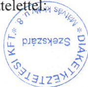
Bay Attila ügyvezető