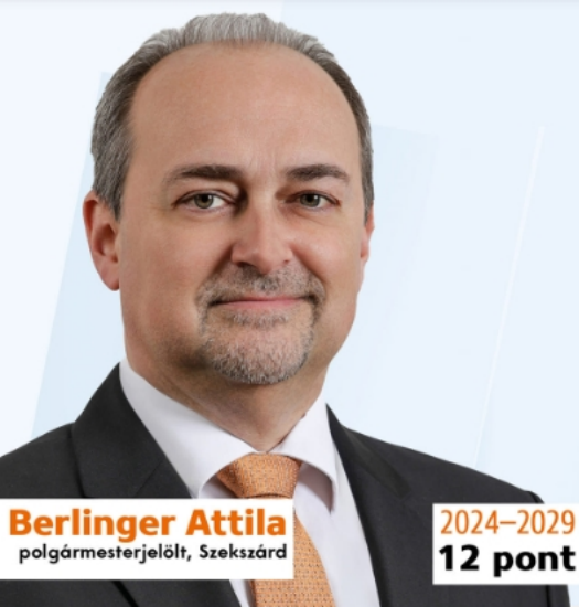
Berlinger Attila polgármesterjelölt, Szekszárd