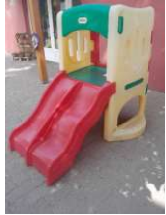
Óvoda utcai Mini Bölcsőde