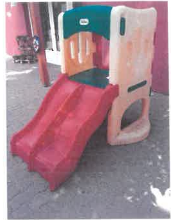
Óvoda utcai Mini Bölcsőde