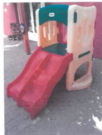
Óvoda utcai Mini Bölcsőde