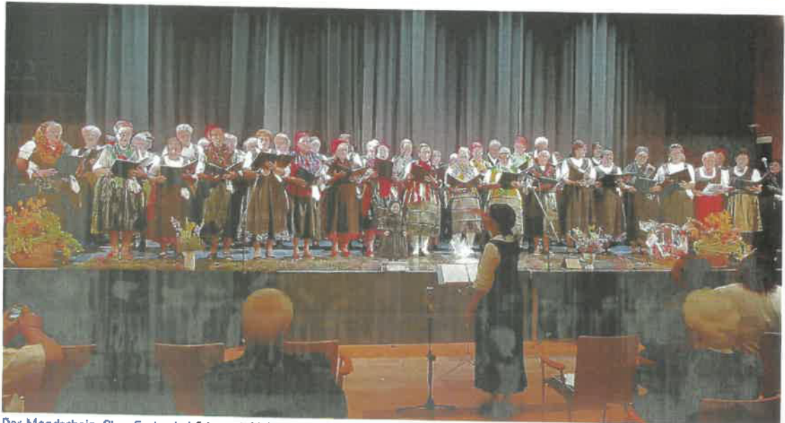
Der Mondschein-Chor Szekszárd feierte Jubiläum: die Chöre aus Szekszárd, Mesch (Mözs) und Kokersch (Kakasd) singen zusammen