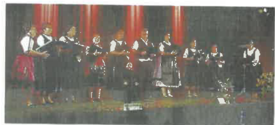
Der deutsche Chor aus Kokersch (Kakasd)