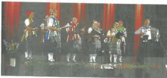
Der deutsche Chor aus Mesch (Mözs)

Danach folgten die Auftritte der eingeladenen Gastchöre, der Deutsche Chor aus Kokersch (Kakasd), aus Mesch (Mözs)