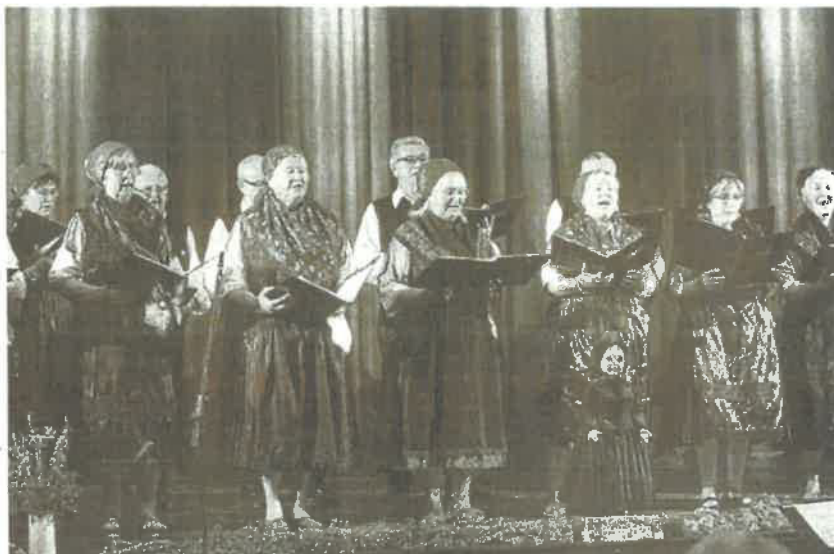
Fennállásának 45. évfordulóját ünnepelte a kórus (galéria és videó: Teol.hu)