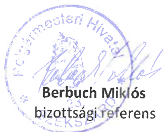
Berbuch Miklós bizottsági referens