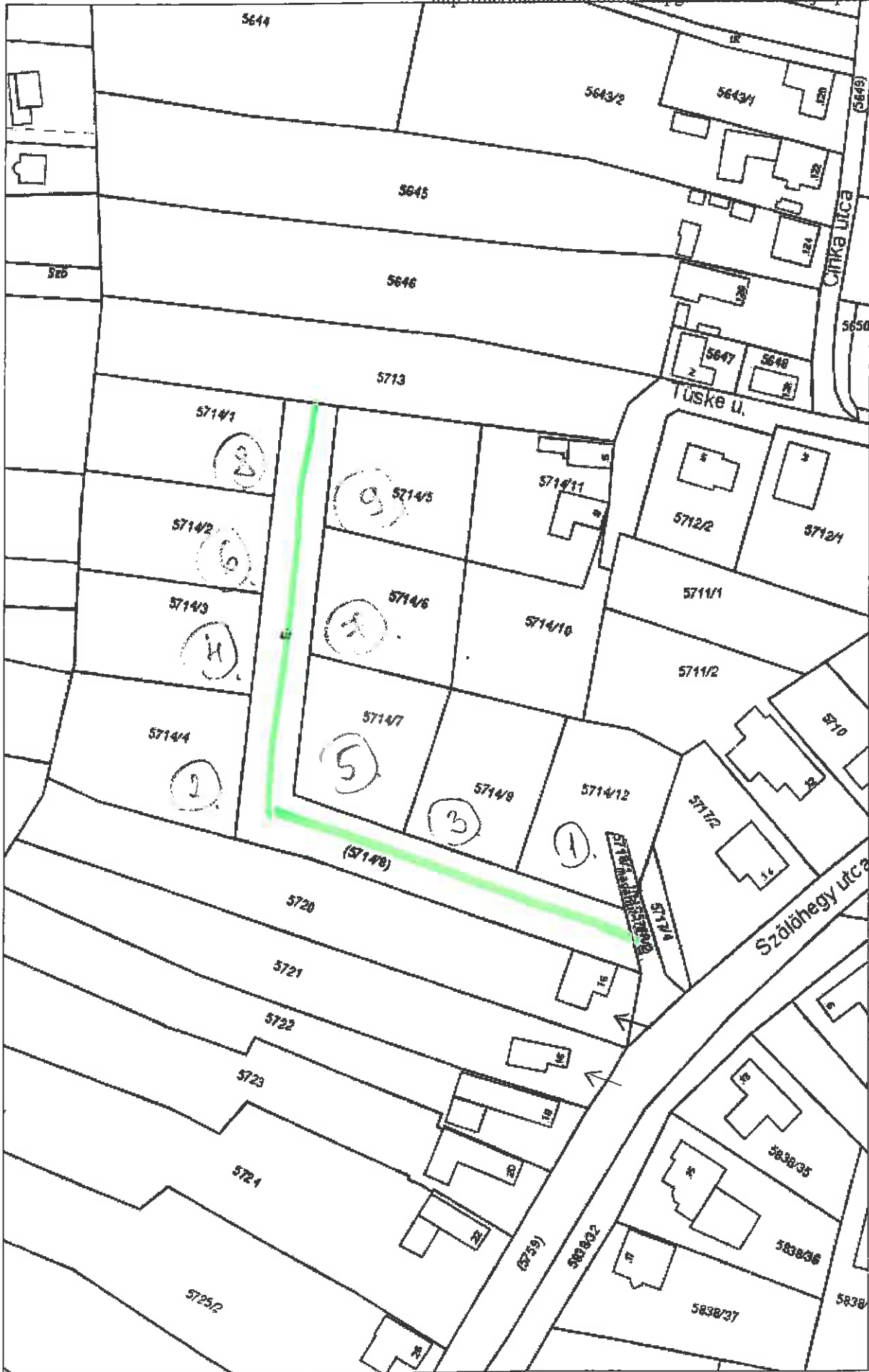
2021.10.20, Szekszárd, M = 1:1200