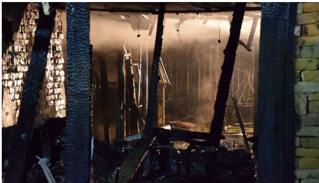
1. sz. kép: Szekszárd, Bródy köz 20.

Megfigyelhető, hogy a kiemelt tűzoltói beavatkozások száma 2020-ban átlagosnak mondható 1 db IV/K, illetve 2db II/K riasztási fokozatú káreseményről 2021-ban némi emelkedést mutat, 4 db II/K és 1db IV/K beavatkozással. A ténylegesen megvalósult magasabb riasztási fokozatú beavatkozások az összes esemény ~1%-át tették ki. A káresemények 99 %-a I-es, vagy I/K riasztási fokozatnak megfelelő erővel és eszközökkel felszámolható volt. A magasabb riasztási fokozatban megvalósult esetek közül kiemelkedő volt, január 7-én Szekszárd, Bródy köz 20. 100 nm alapterületű, sorházi lakóház és tetőtere teljes terjedelmében égett, fokozat: IV/K.