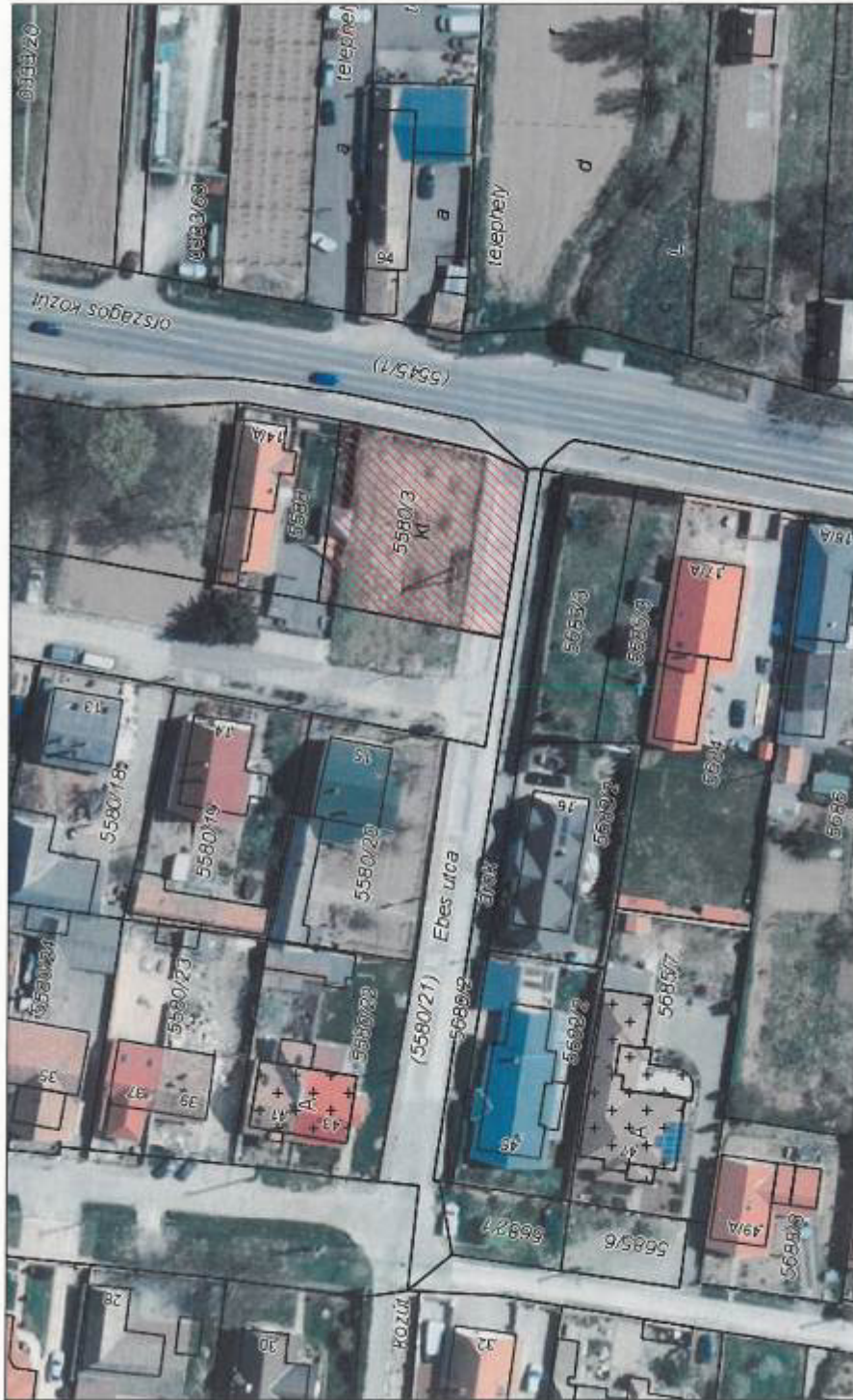
2021.7.7. Szekszárd, M = 1:800