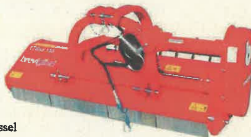
A kép csak illusztráció