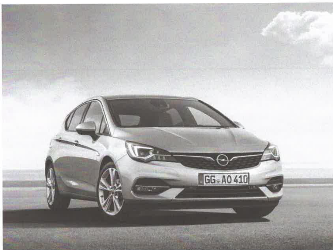
Új Opel Astra GS Line D 15 DVH S/S (90 kW / 122 HP) MT6

Amennyiben az árajánlattal kapcsolatban bármilyen kérdése felmerülne, kérem, keressen bizalommal! Árajánlatunk a hivatalos OSE árlista, illetve az egyedi flottakedvezmények visszavonásáig érvényes.