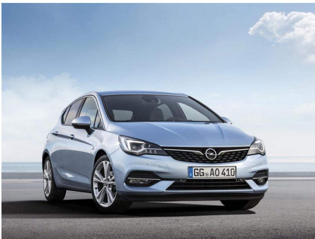
Opel Astra GS Line D 15 DVH S/S (90 kW / 122 HP) MT6 Elegance felszereltség

Amennyiben az árajánlattal kapcsolatban bármilyen kérdése felmerülne, kérem, keressen bizalommal! Árajánlatunk a hivatalos OSE árlista, illetve az egyedi flottakedvezmények visszavonásáig érvényes.