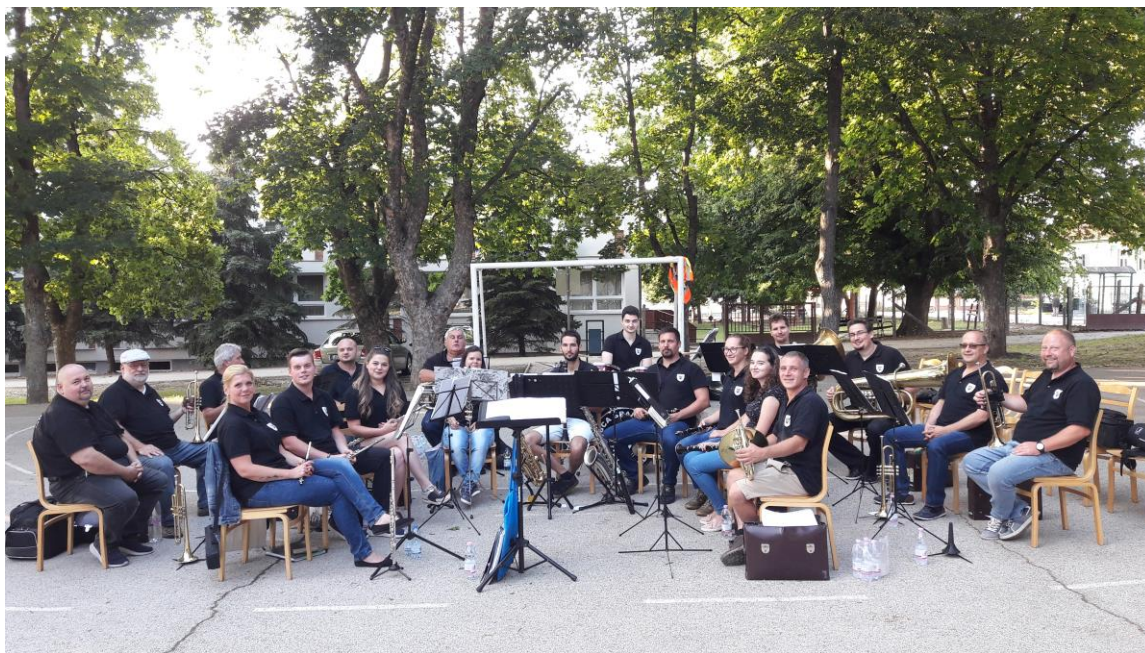
Tengelic, 2020. július 18.