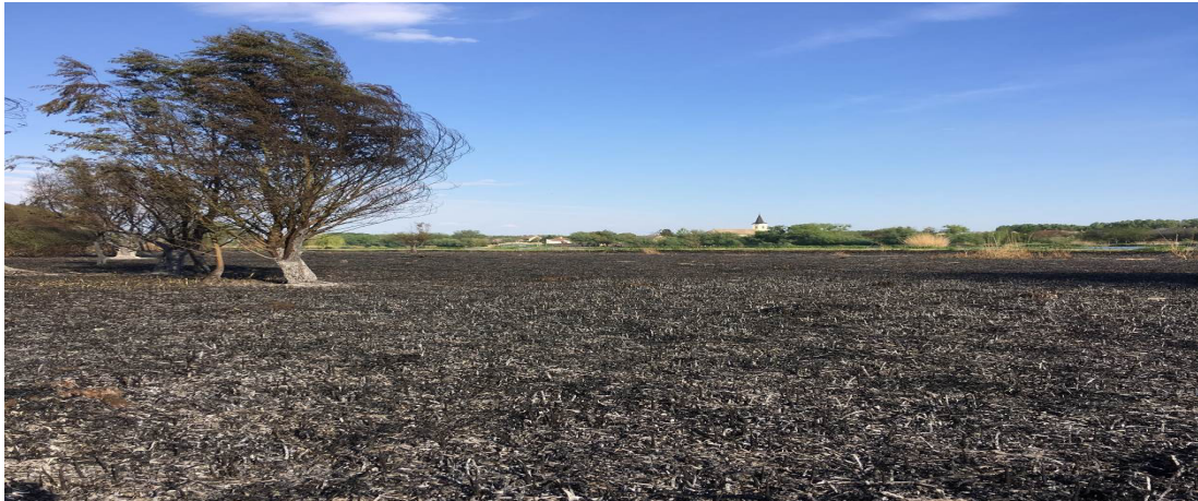
1. sz. kép: Bogyiszló külterület, nádas, avar gaz

Július 17-én Hidas településre vonultak a tűzoltók nagy erővel, ahol egy lakóépület és a hosszában hozzáépített melléképület tetőszerkezete teljes terjedelmében égett. A tüzet 7 vízsugárral és kéziszerszámok segítségével oltottuk el.