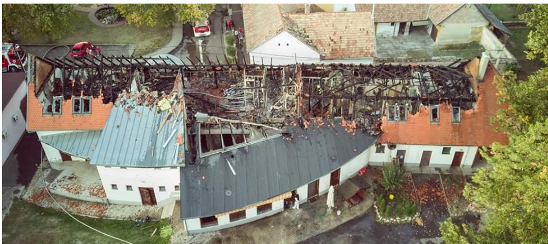
2. sz. kép: Szászvár Fogadó és Faluház

Október 08-án , délután, Szászvár településről jelentettek tüzet, ahol a Fogadó és Faluház tetőszerkezete és a tetőtér beépítéses panziórész tárgyai égtek teljes terjedelmében. A tüzet 7 db vízsugárral és kéziszerszámokkal oltottuk el.