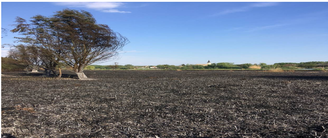
1. sz. kép: Bogyiszló külterület, nádas, avar gaz

Július 17-én Hidas településre vonultak a tűzoltók nagy erővel, ahol egy lakóépület és a hosszában hozzáépített melléképület tetőszerkezete teljes terjedelmében égett. A tüzet 7 vízsugárral és kéziszerszámok segítségével oltottuk el.