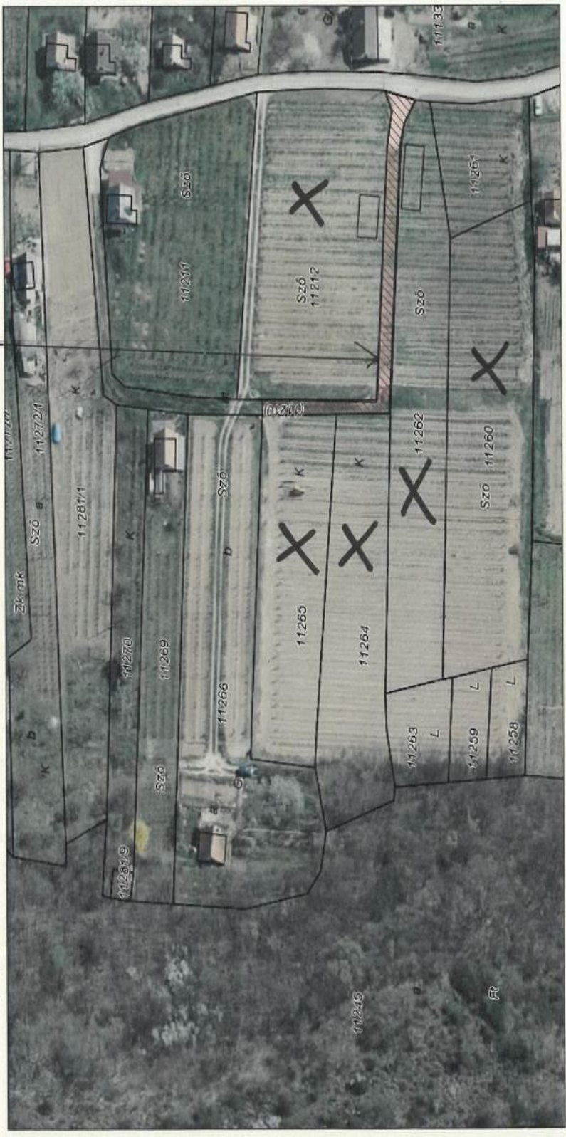
2020.8.18. Szekszárd, M = 1:900