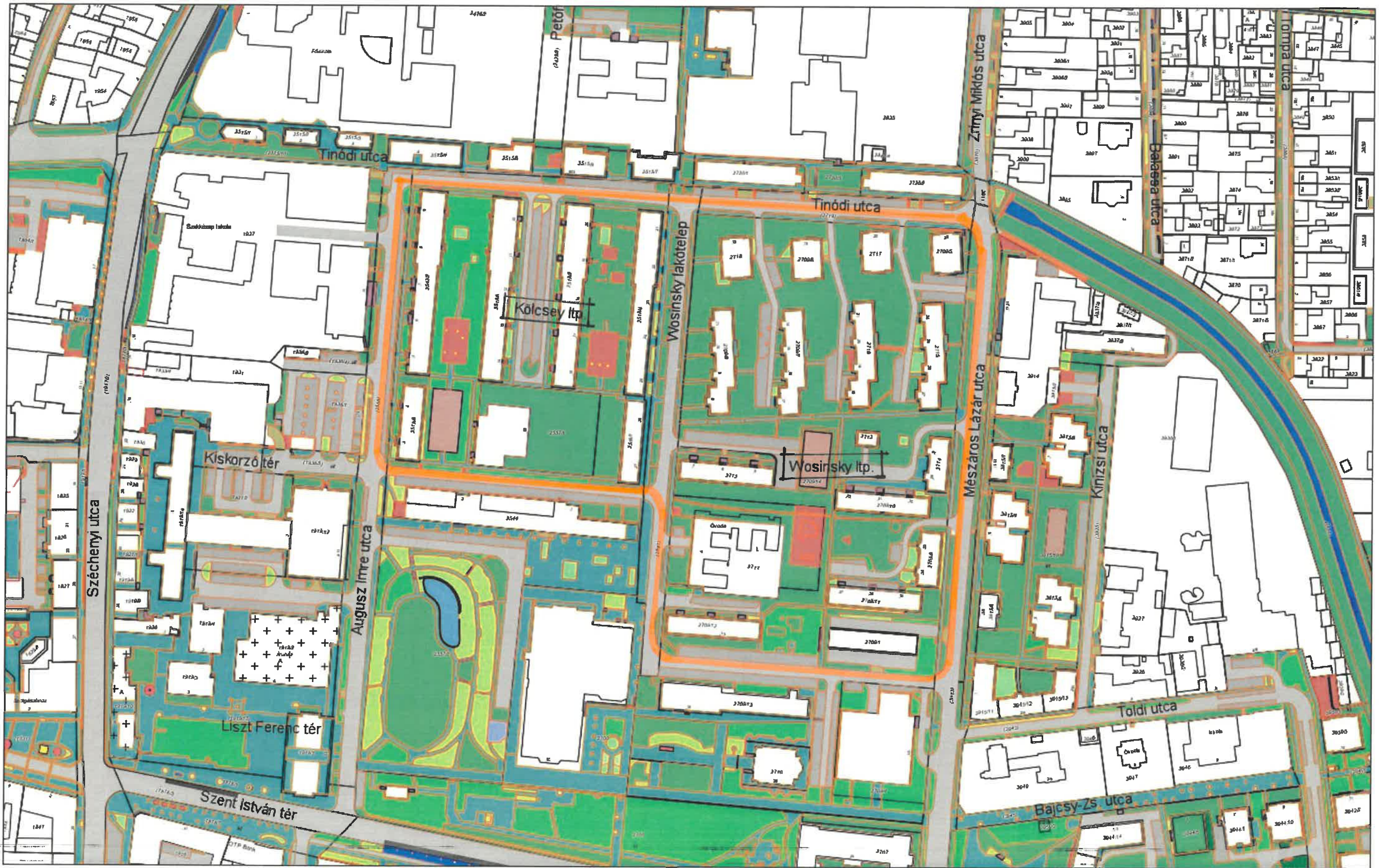
2020.6.11, Szekszárd, M = 1:2000