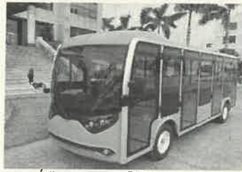
Árlista/Megrendelőlap NRG S23C

Kapcsolattartó 06 70 633 0470 Kapcsolattartó Szombathelyi István