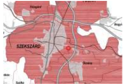
Világörökségi és világörökségi várományos terület övezete