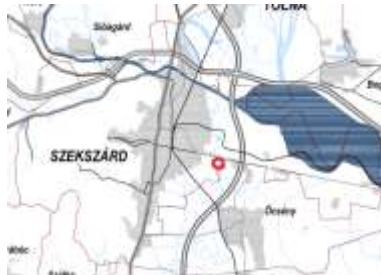
Nagyvízi meder övezete