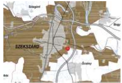
Ásványi nyersanyagvagon terület övezete