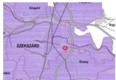
Földtani veszélyforrás terület övezete