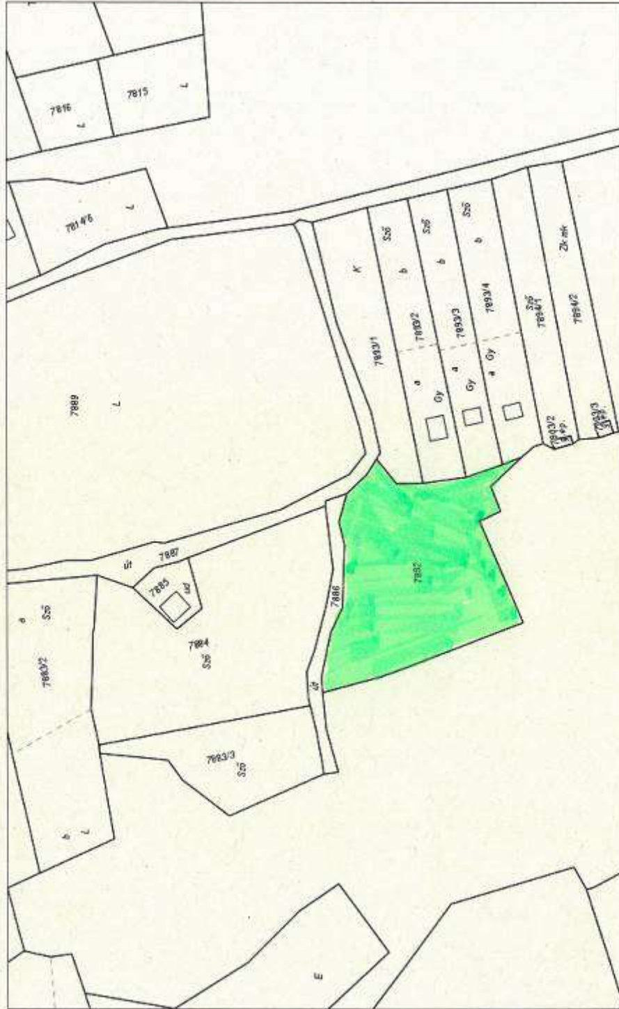
2019.6.13, Szekszárd, M = 1:1235