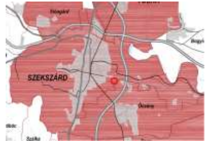
Világörökségi és világörökségi várományos terület övezete