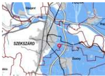
Rendszeresen belvízjárta terület övezete