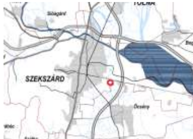
Nagyvízi meder övezete