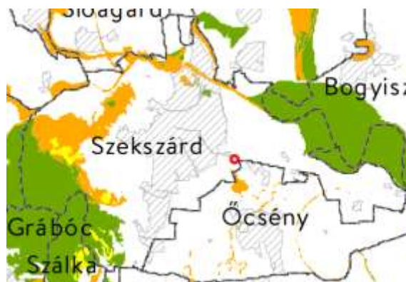
Ökológiai hálózat övezetei

4. Kiváló termőhelyi adottságú szántók övezete (Trtv. 28.§): A tervezési terület nem érintett.