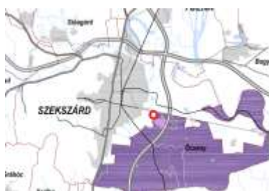
Tájrrehabilitációt igénylő terület övezete