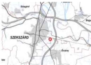
Kiemelt fontosságú honvédelmi terület, honvédelmi terület övezete