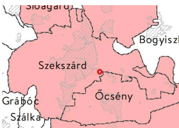
Világörökségi és világörökségi várományos ter. öv.

9. Világörökség és világörökség várományos terület övezete (Trtv. 31.§): A település érintett, azonban a tervezési területet nem érinti.