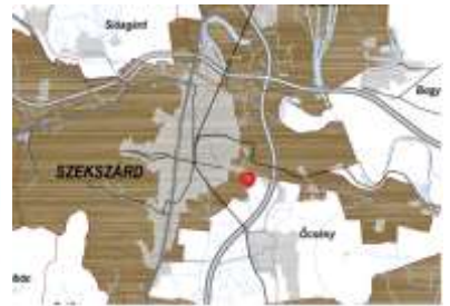
Ásványi nyersanyagvagon terület övezete