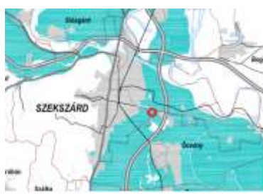
Széltermőpark telepítéséhez vizsgálat alá vonható terület övezete