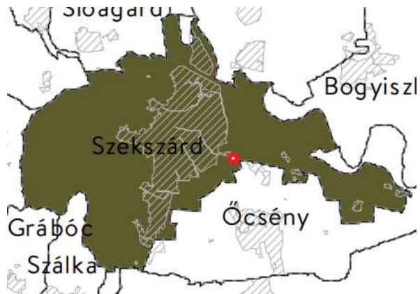
Honvédelmi és katonai célú terület övezete

10. Vízminőség-védelmi terület övezete : A vonatkozó jogszabály még nem jelent meg.