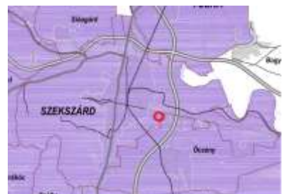
Földtani veszélyforrás terület övezete