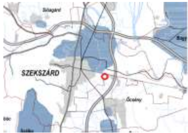
Országos vízminőségvédelmi terület övezete