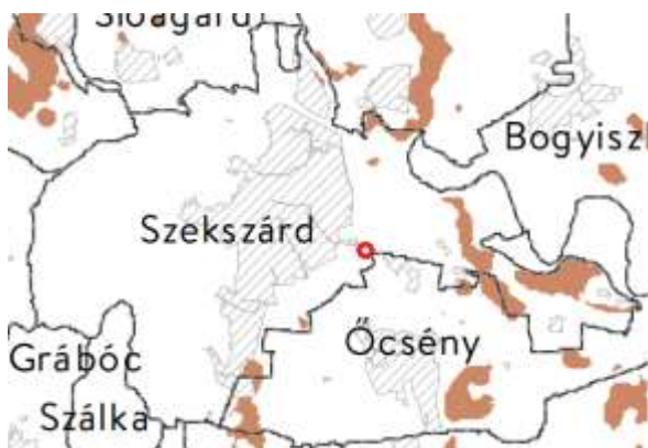
Kiváló termőhelyi adottságú szántók övezete

5. Jó termőhelyi adottságú szántók övezete: A vonatkozó jogszabály még nem jelent meg.