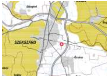
Tájképvédelmi szempontból kiemelten kezelendő terület övezete