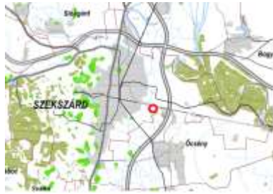
Kiváló termőhelyi adottságú erdők és erdőtelepítésre javasolt terület övezete