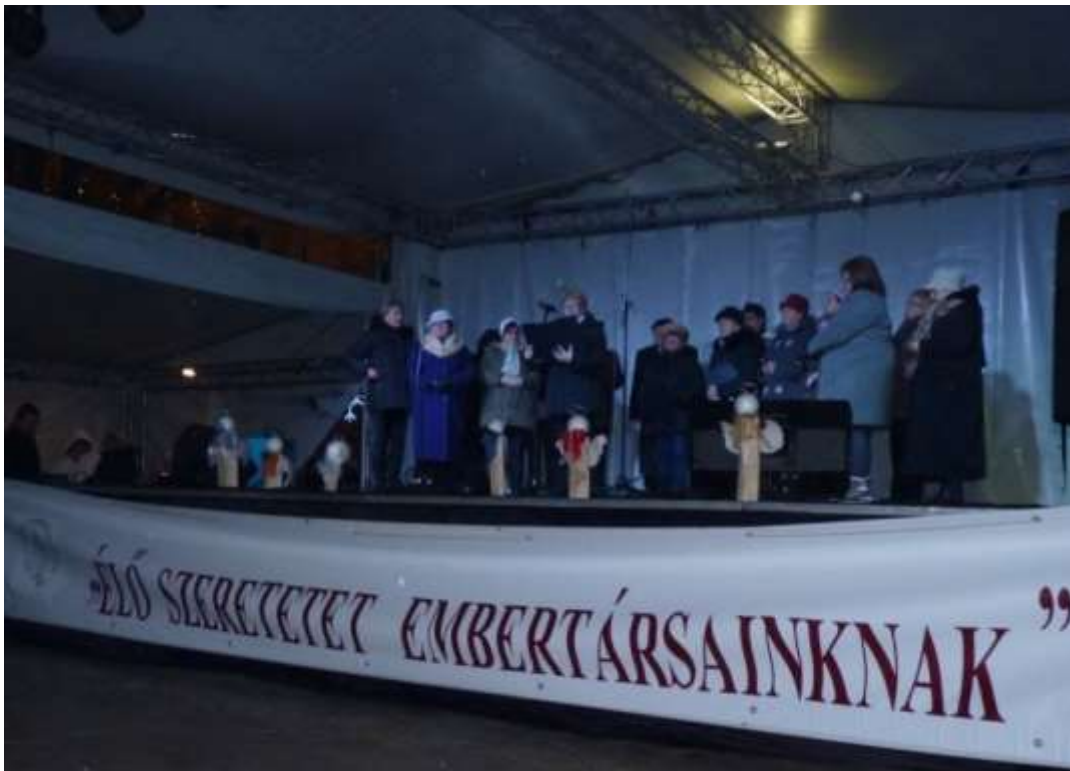
A Bukovinai Székelyek Szekszárdi Egyesületének műsora