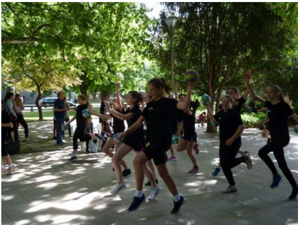
A Fekete Gólyák Kézilabda Club Szekszárd produkciója