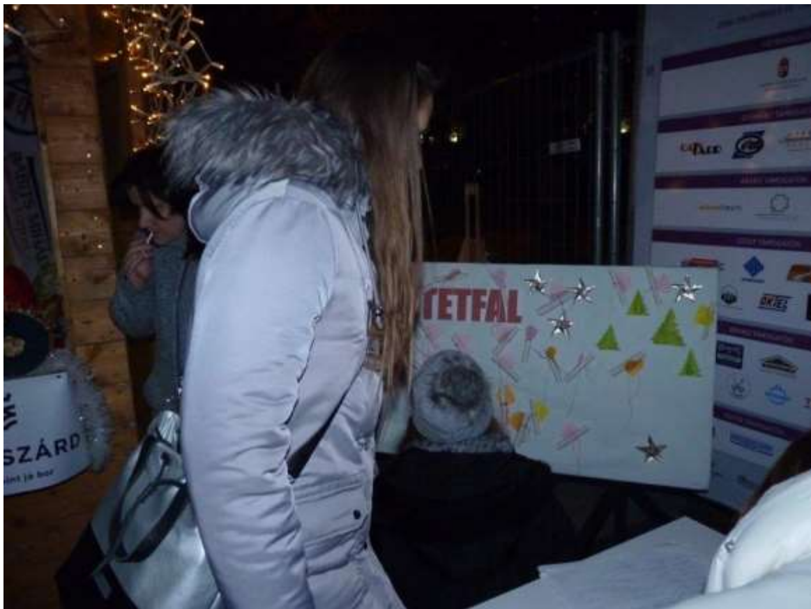
Gyűlnek a „Szeretefal” üzenetei