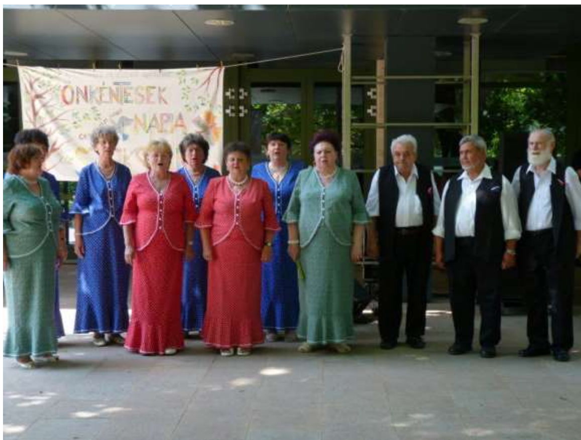
Dalra fakadt a Szekszárdi Magyaróráta Klub is