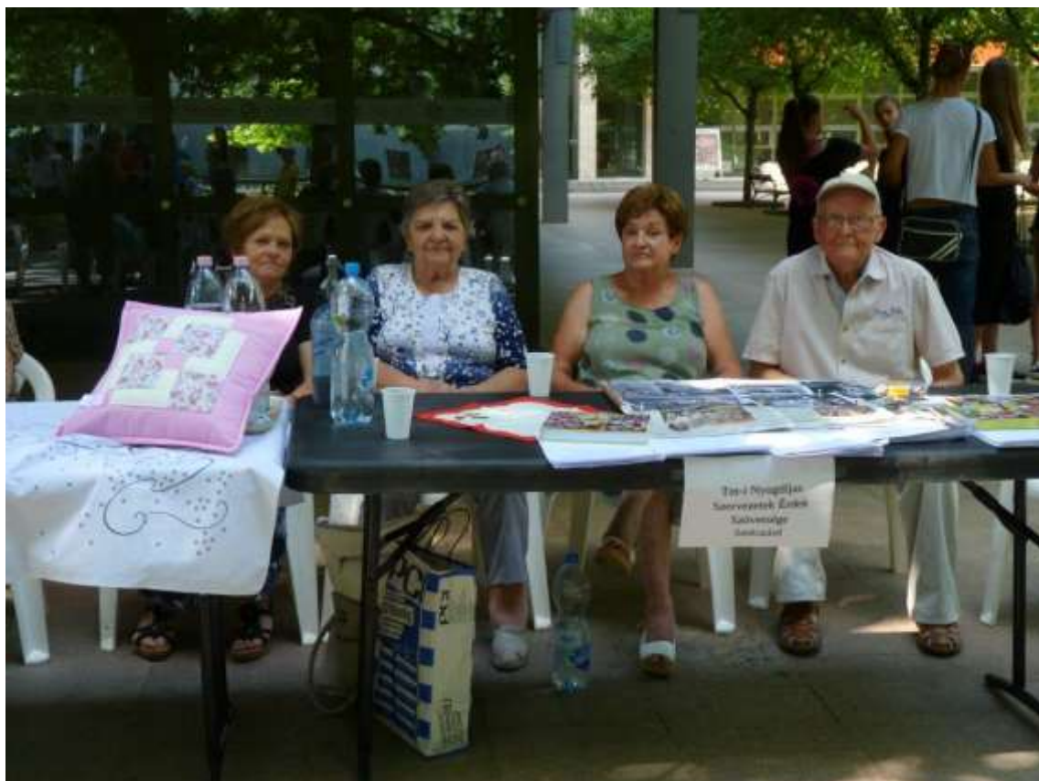
A Tolna Megyei Nyugdíjas Szervezetek Érdekszövetsége önkéntesei