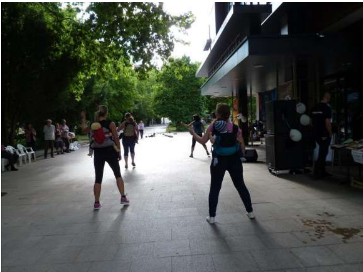
A legapróbb aktív állampolgárok - FITT Anyuka Boldog Baba Sportegyesület