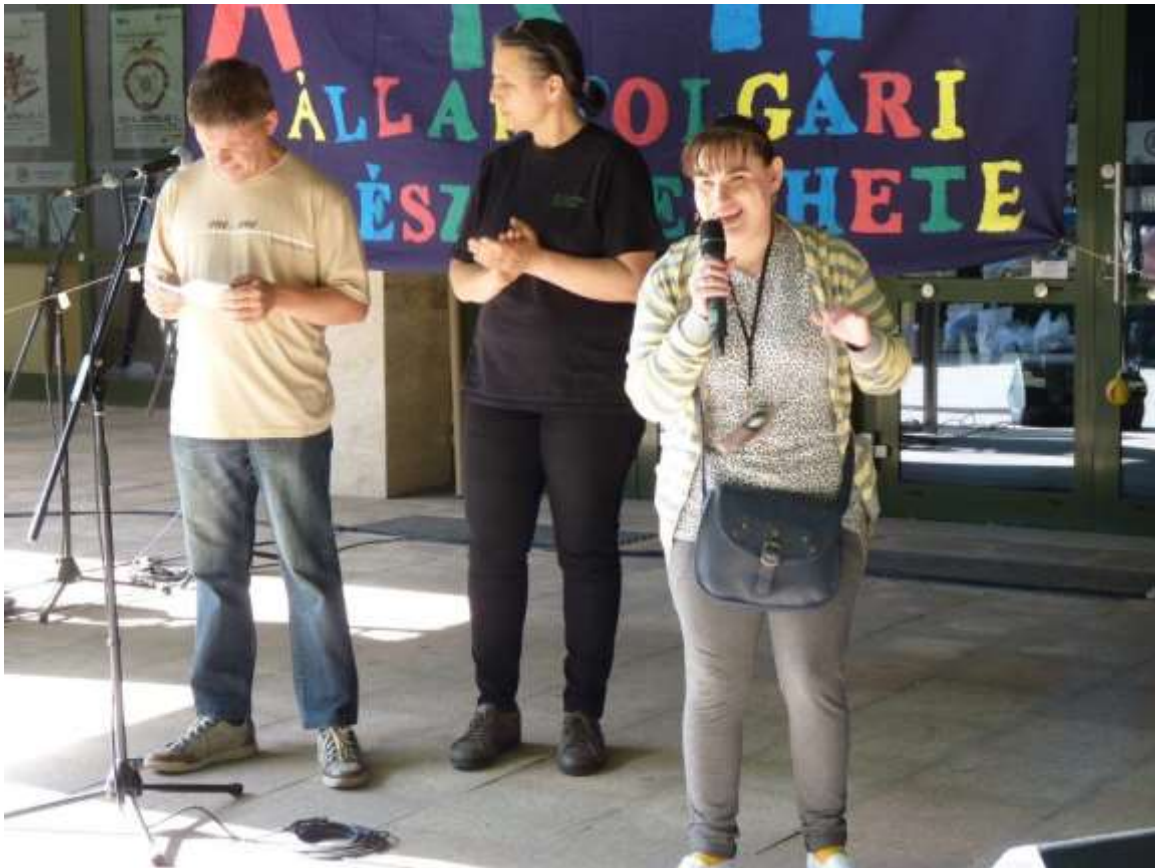
A "Segíts Rajtam" Hátrányos Helyzetűekért Alapítvány bemutatkozása