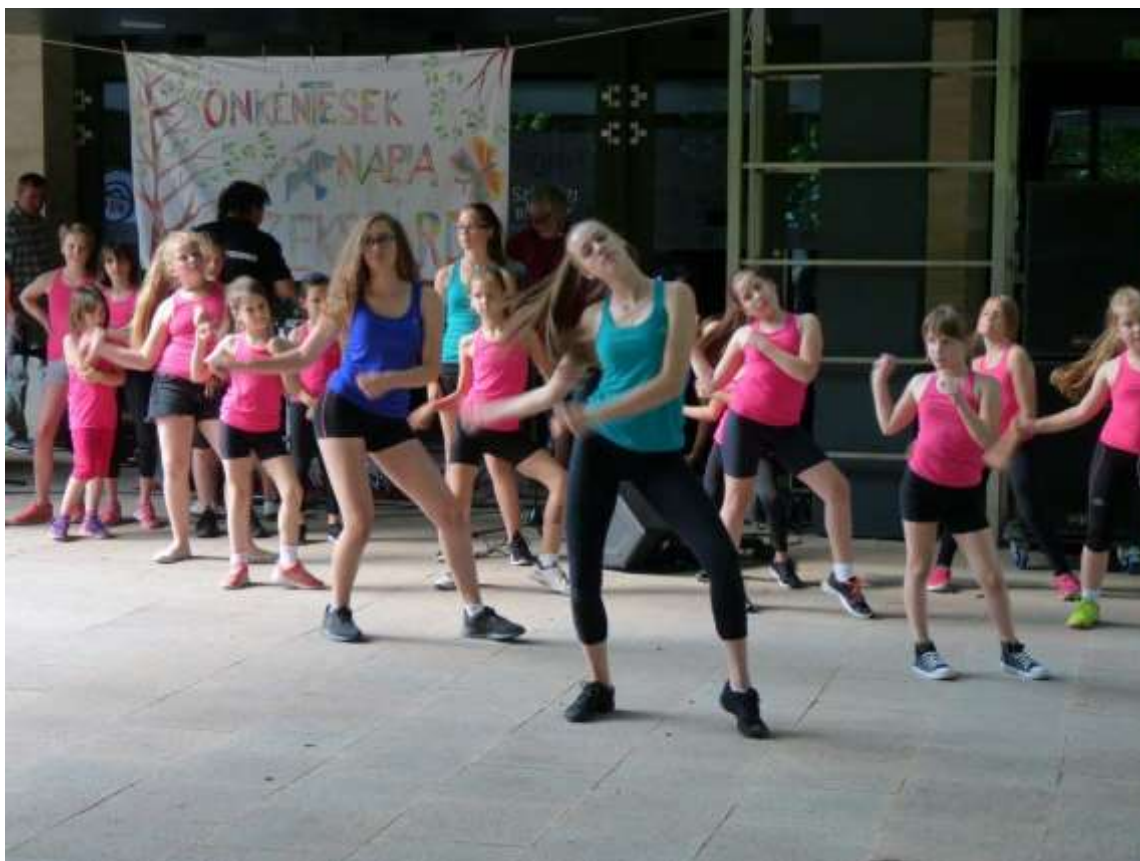
A Mozduljunk Szekszárdért Egyesület tánca