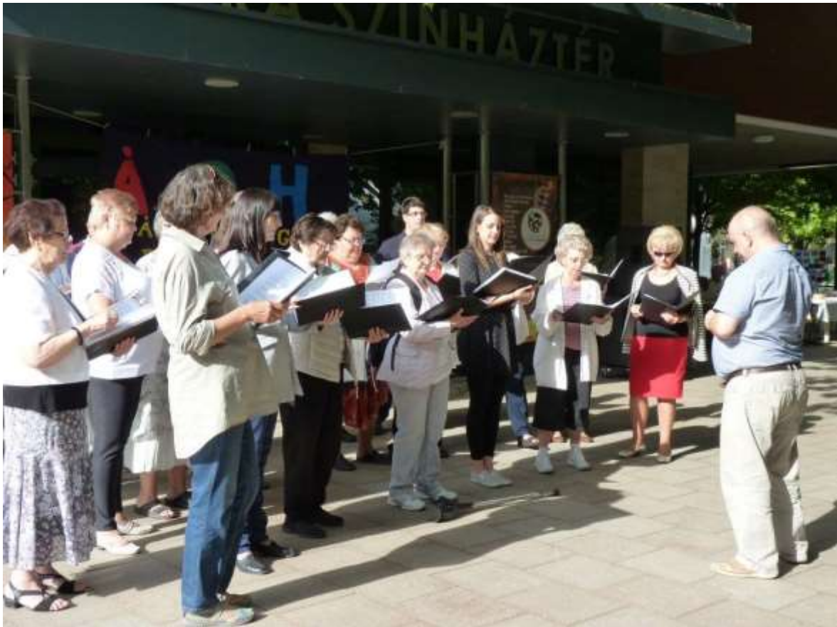
A Liszt Ferenc Pedagógus Kórus előadása