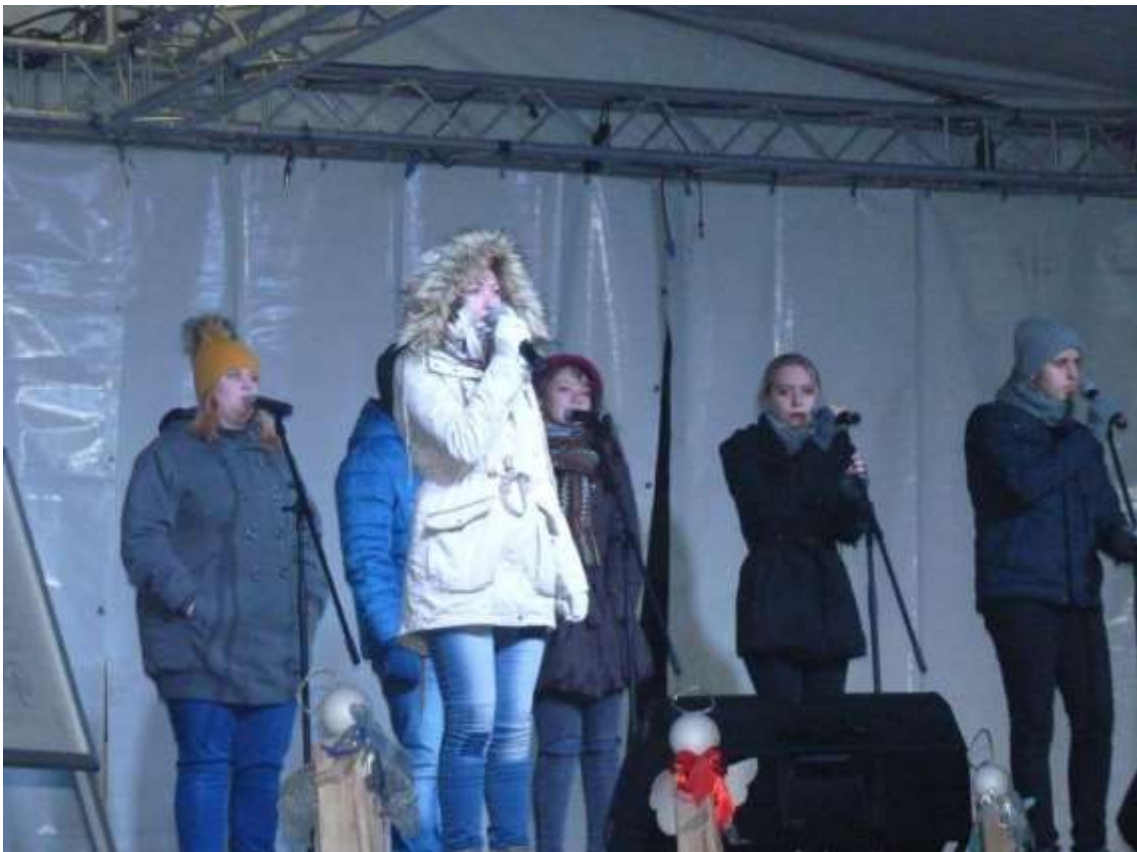
A Tücsök Zenés Színpad Egyesület szólistái