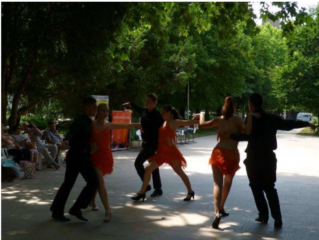
A Gemenc TáncSport Egyesület bemutatója