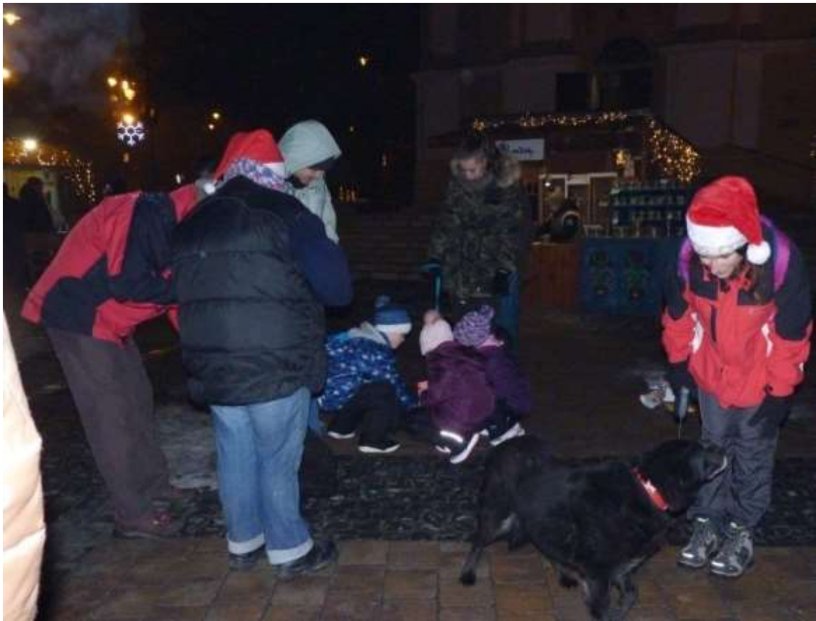
A Tolna Megyei Állat-és Természetvédő Alapítvány interaktív kutyás játszója