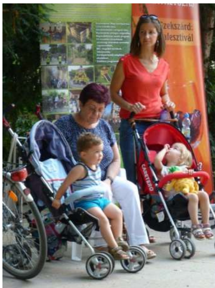
Érdeklődő résztvevők minden generációból