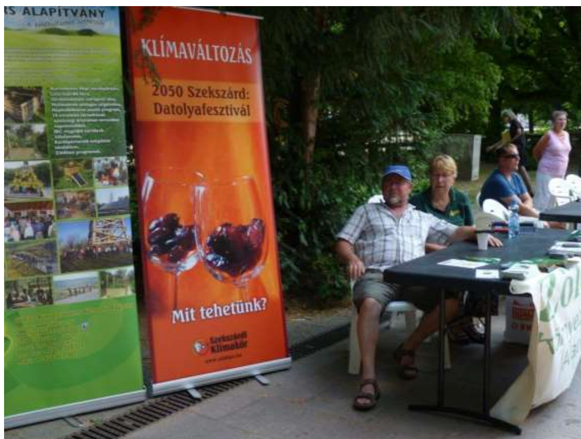
A Zöldtárs Alapítvány képviselői