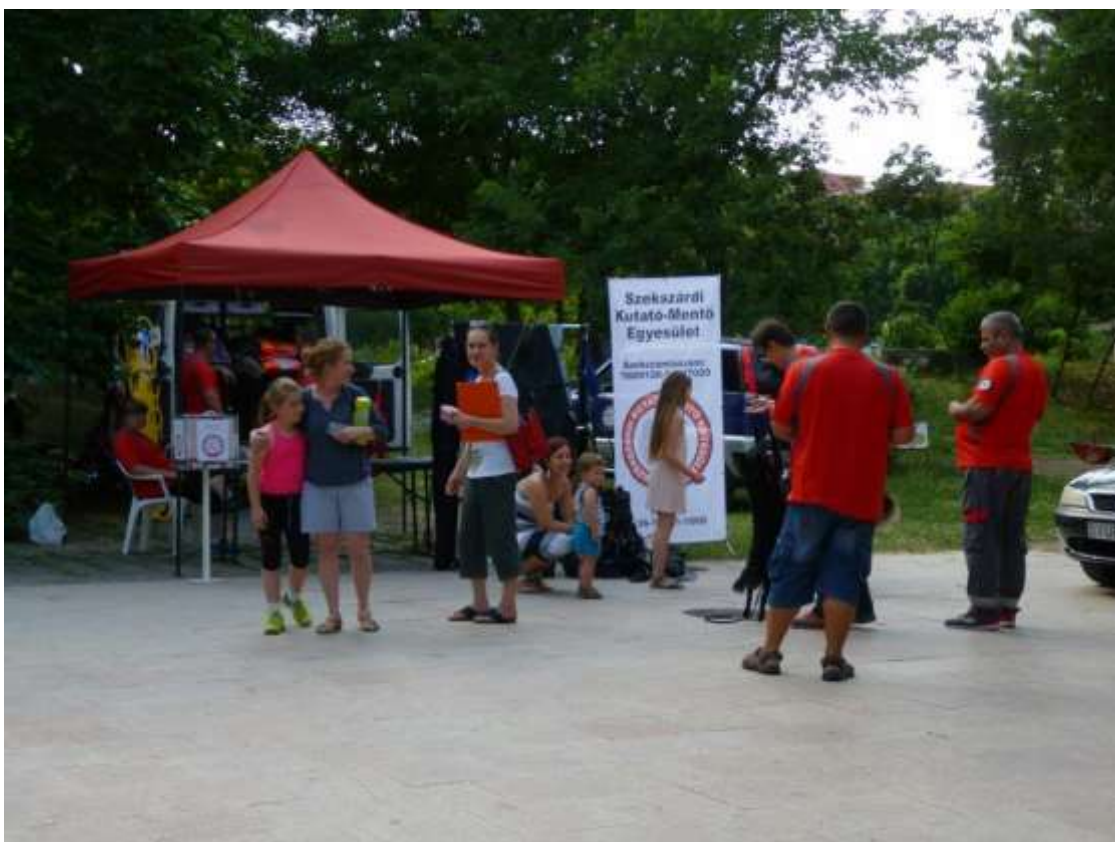
Kitelepült a Szekszárdi Kutató-Mentő Egyesület is