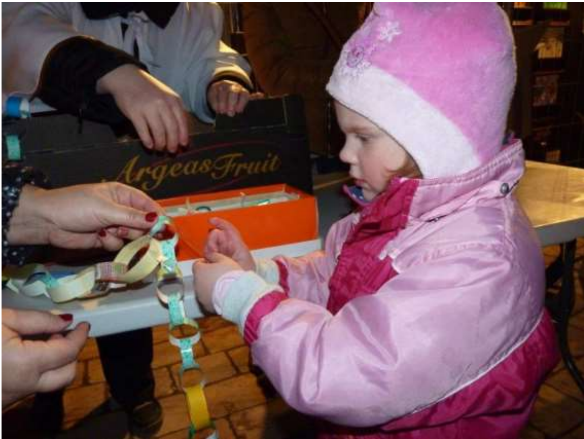
Készül az angyalfüzér