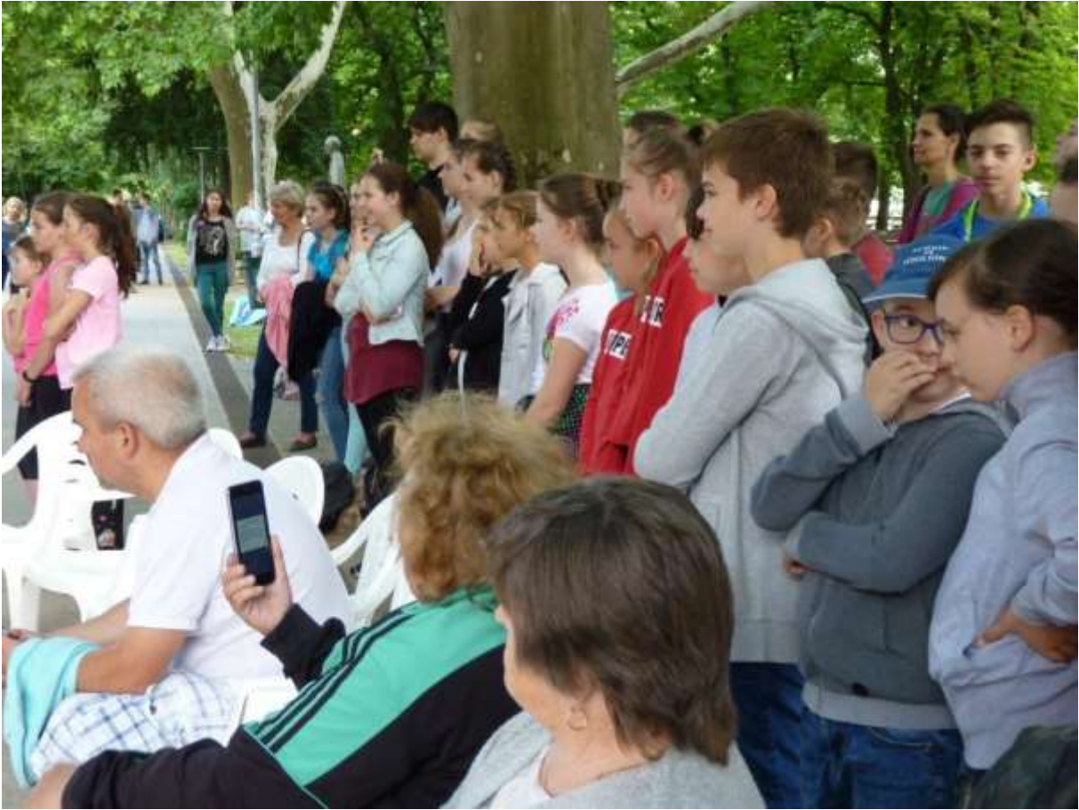
Az érdeklődő közönség