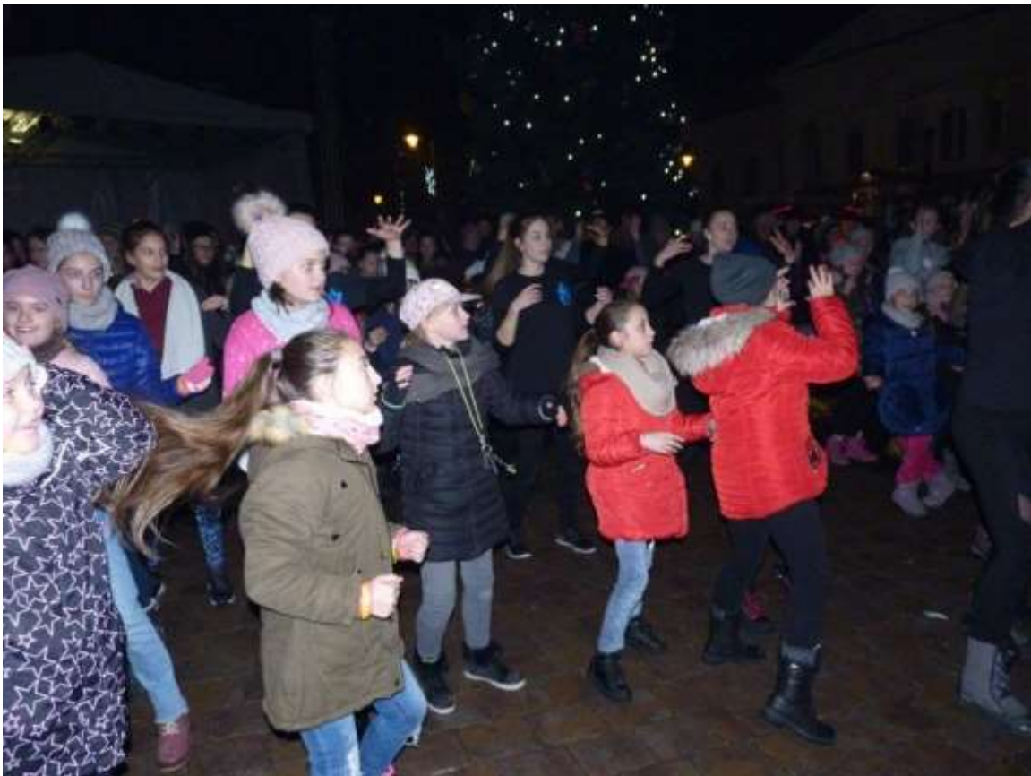
A Mozduljunk Együtt Szekszárdért Egyesület sikeres adventi flashmobja