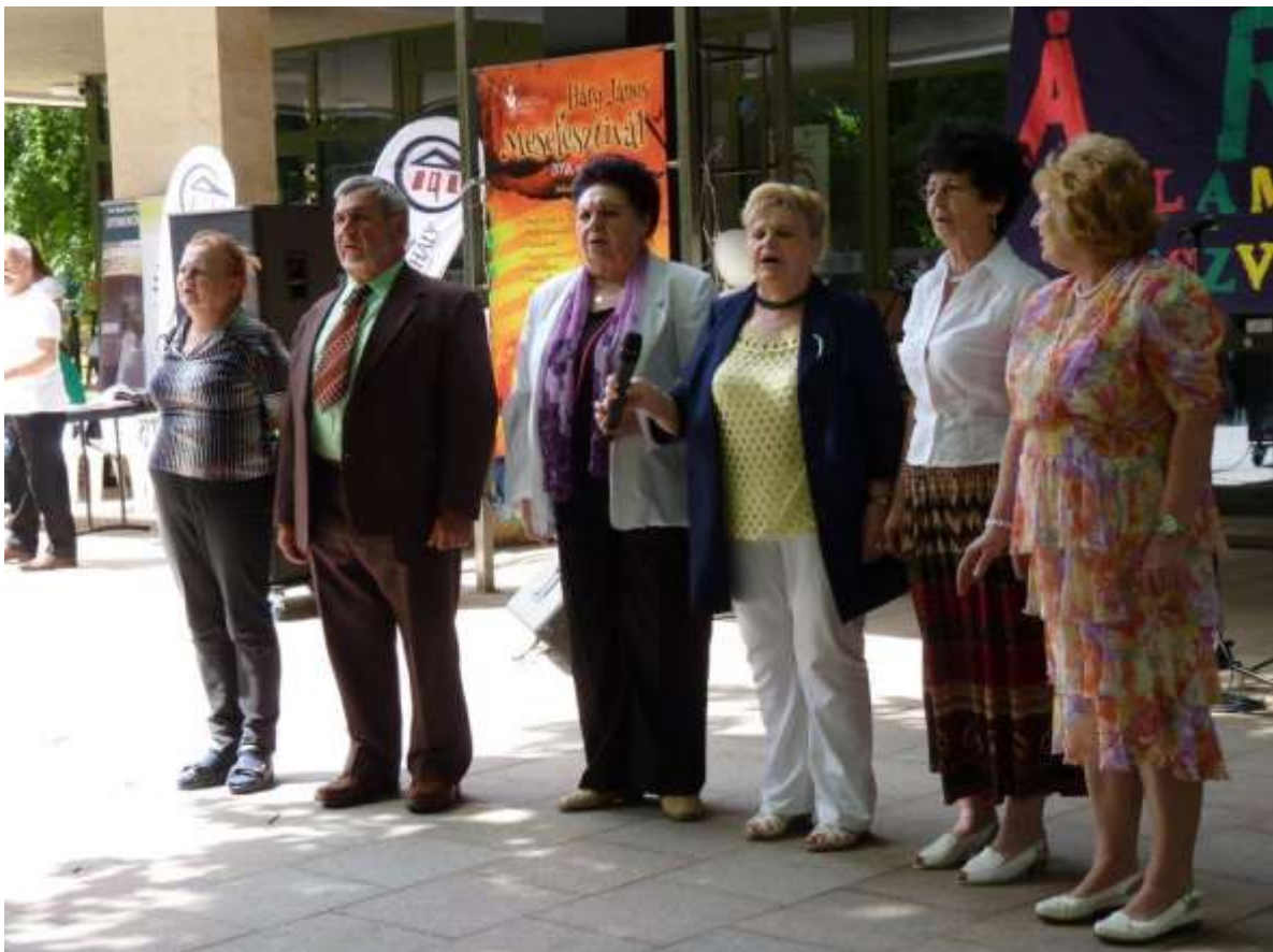
A Szívküldi Dalkör fellépése