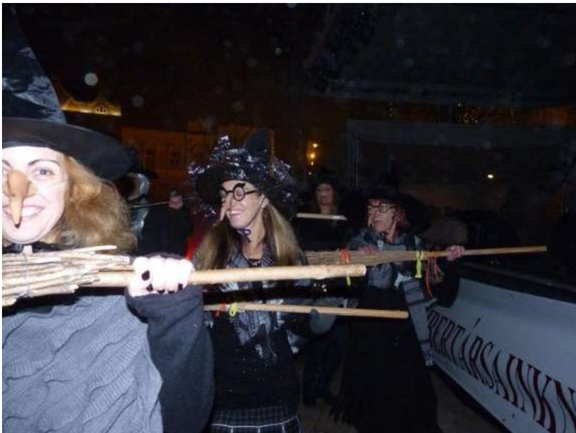
Az Iberican Táncgyűlés és a Fitt Lesz Sportegyesület Luca napi fergeteges boszorkánytánca