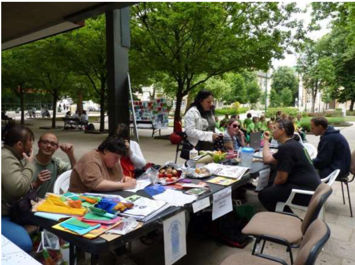
A kitaró civil szervezetek