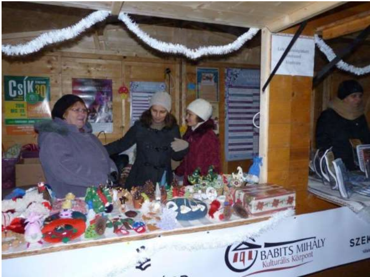
A Lelki Egészségünkért Alapítvány önkéntesei gyűjtik az adományt