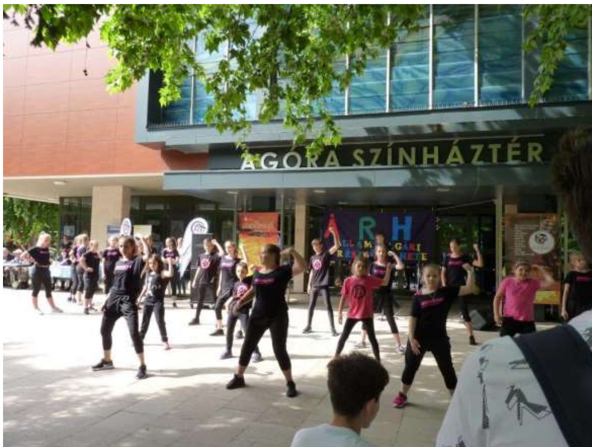
Az Iberican Táncgyesület bemutatója