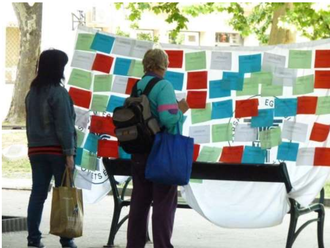
Érdeklődés az ÁRH cetlik iránt