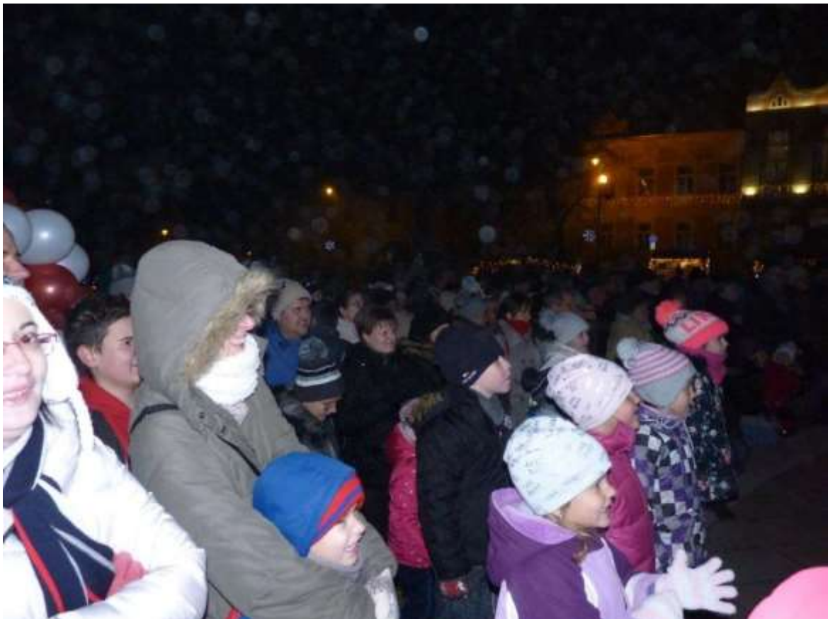
Az ÉSZE lelkes közönsége