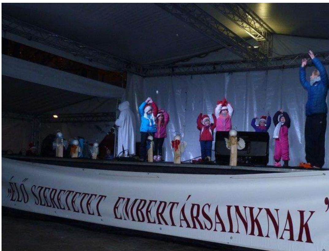
A Szekszárdi Mozgásművészeti Stúdió fellépése