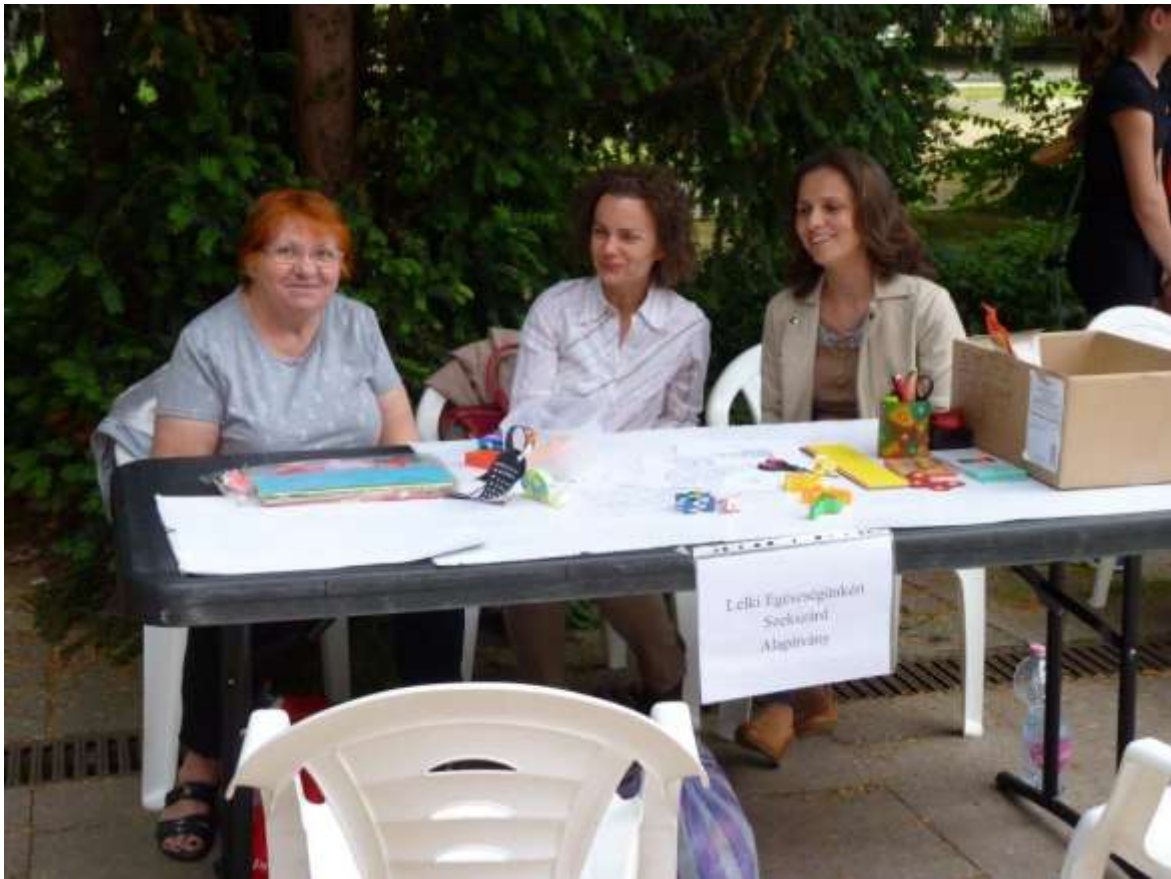
A Lelki Egészségünkért Szekszárd Alapítvány vidám önkéntesei