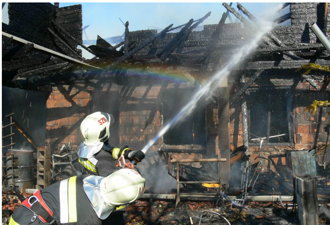
2. sz. kép. Decs, rönkház tűz

Március 04-én Decs Csiga Major területén egy több mint 200 m 2 alapterületű kétszintes ház, amelynek a felső része fából készült, teljes terjedelmében leégett. A tűz tovább terjedt az épület környezetére és az ott elhelyezett fa rakatokra. Az épületből két 21 kg-os PB gázpalackot hoztunk ki. A tüzeset során személyi sérülés nem történt. A tüzet több órás munkával, 5 „C” és 2 „D” sugárral oltottuk el.