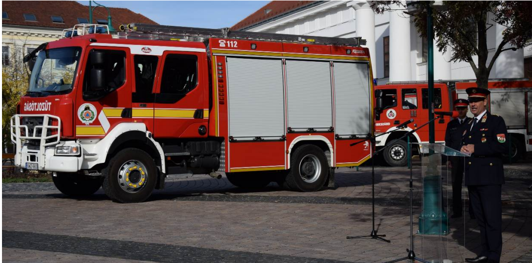
1. sz. kép: Rába gépjárműfecskenő ünnepélyes átadása

Az emlékhely látogathatósága folyamatosan biztosított. Egyre több látogató érkezik az óvodás csoportoktól elkezdve egészen a nyugdíjas korosztályig.