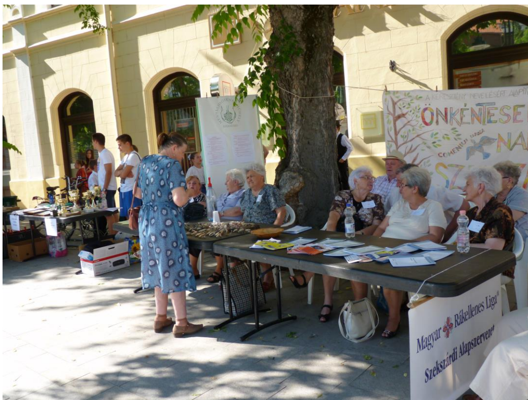
Szolgálatban a kitelepült önkéntesek