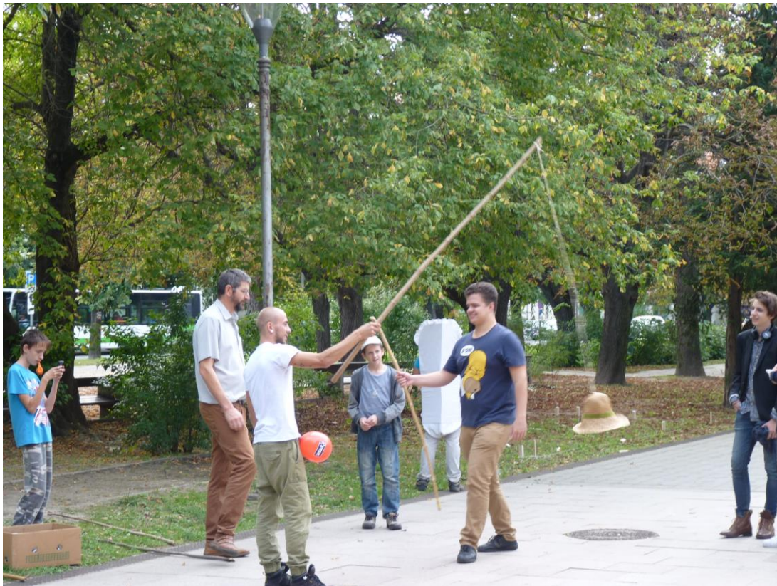
A Szent József Katolikus Iskolaközpont lelkes csapata aktivizálja az érdeklődőket