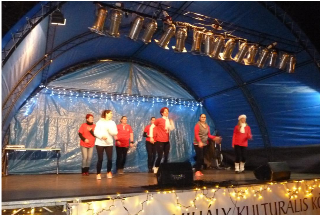
Karácsonyi Zumba bemutató a FITT Fitnessszel