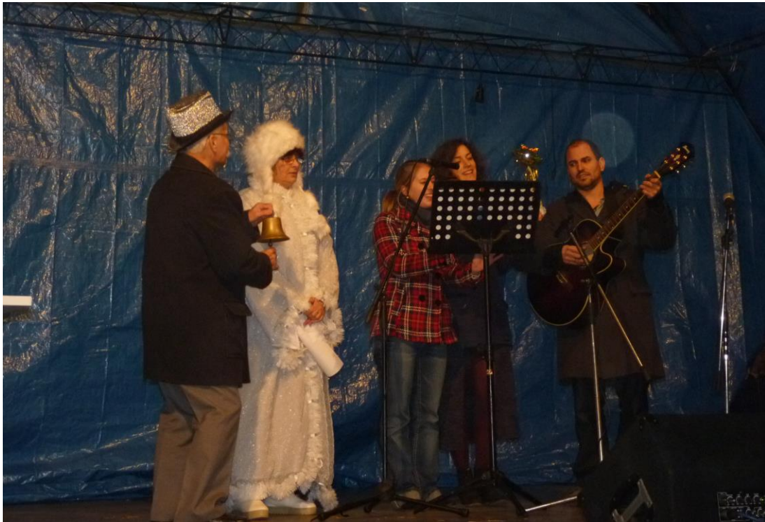
A Magyarországi Német Színház (DBU) társulatának fellépése