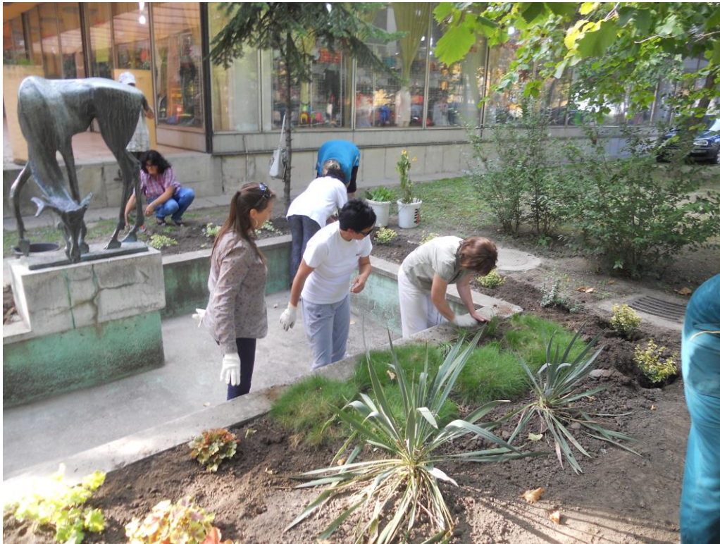
Szépül az Ivó Szarvas környezete a „Sternlein” Egyesület szervezésében