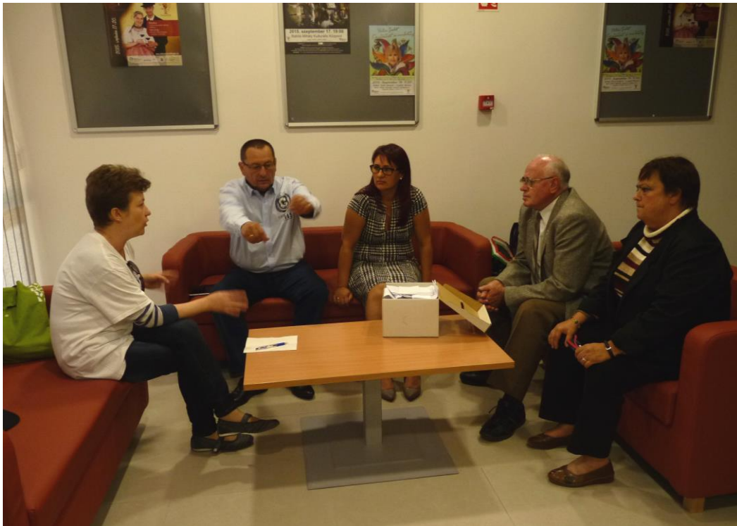
Megkezdí a kuratórium a munkáját