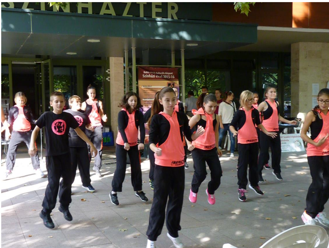
Az Iberican Táncgyűttes lelkesítő fellépése