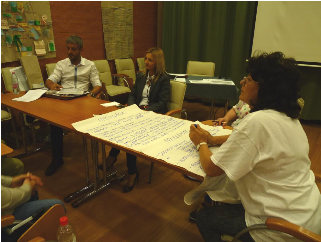
Közös ötletelés az élhetőbb városért