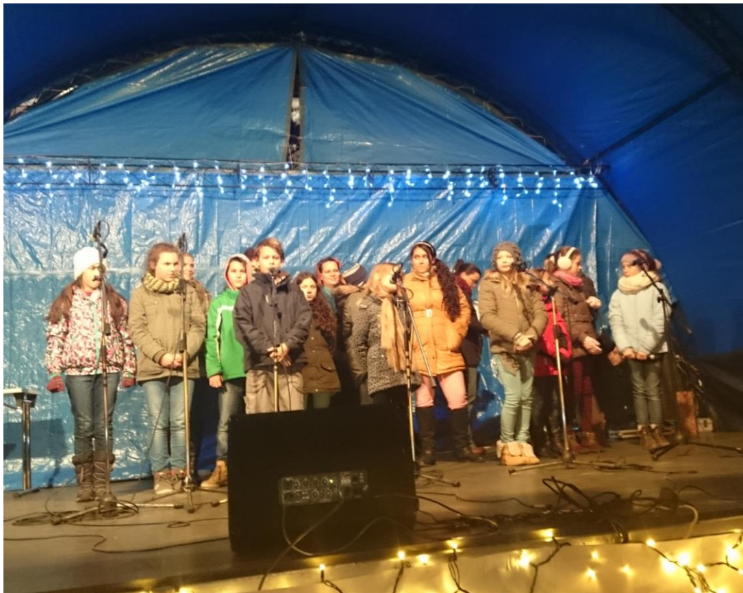
A Csizmazia Alapítvány a Jövő Ígéretes Gyermekeiért karácsonyi köszöntője