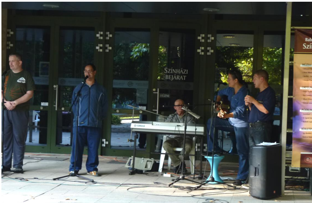
A „Segíts Rajtam!” Hátrányos Helyzetűekért Alapítvány műsorával aktivizálja a résztvevőt