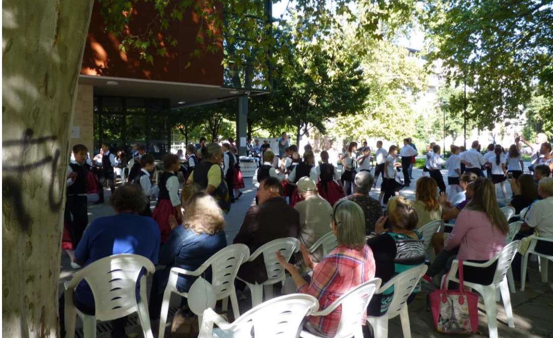
Az érdeklődők és a résztvevők tábora