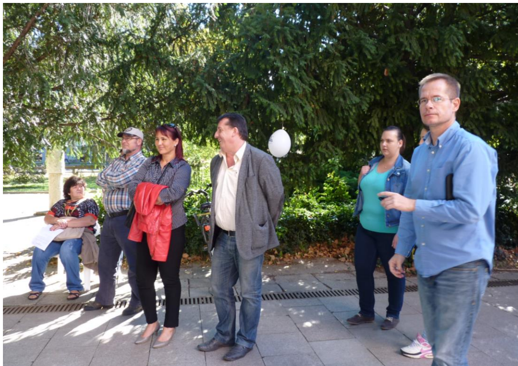
Az ünnepélyes megnyitóra várakozók