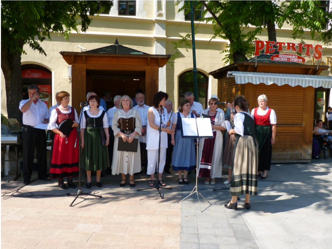
A „Mondschein” Szekszárdi Német Nemzetiségi Kórus készül a Hála-Gála fellépésére