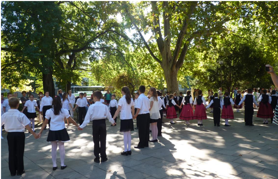
Az általános iskolások („Ifjú Szív”utánpótlás csoportjai) hagyományos nyitótánc