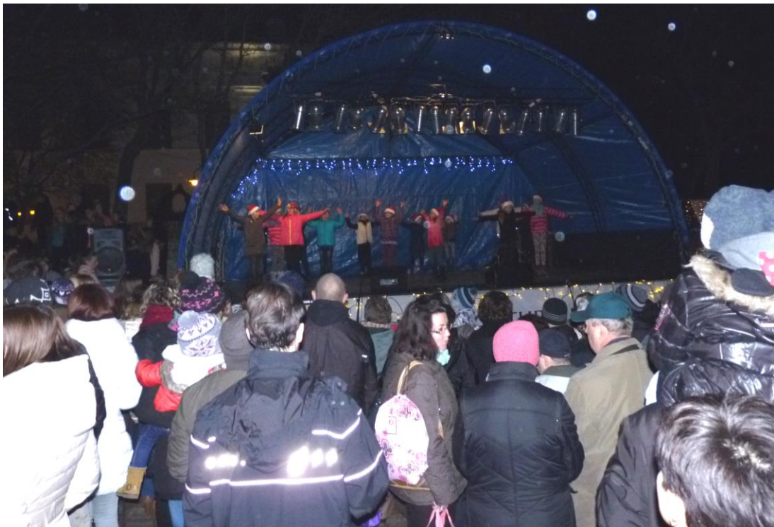
A Szekszárdi Mozgásművészeti Stúdió karácsonyi mozgásperekkel szórakoztatja a közönséget