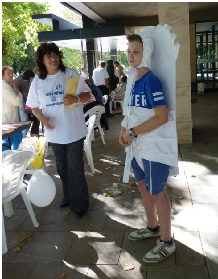
Indul „Az egészségügy a szívügyünk!” kis önkéntesével az adománygyűjtés a Tolna Megyei Balassa János Kórház Gyermekek Osztálya számára