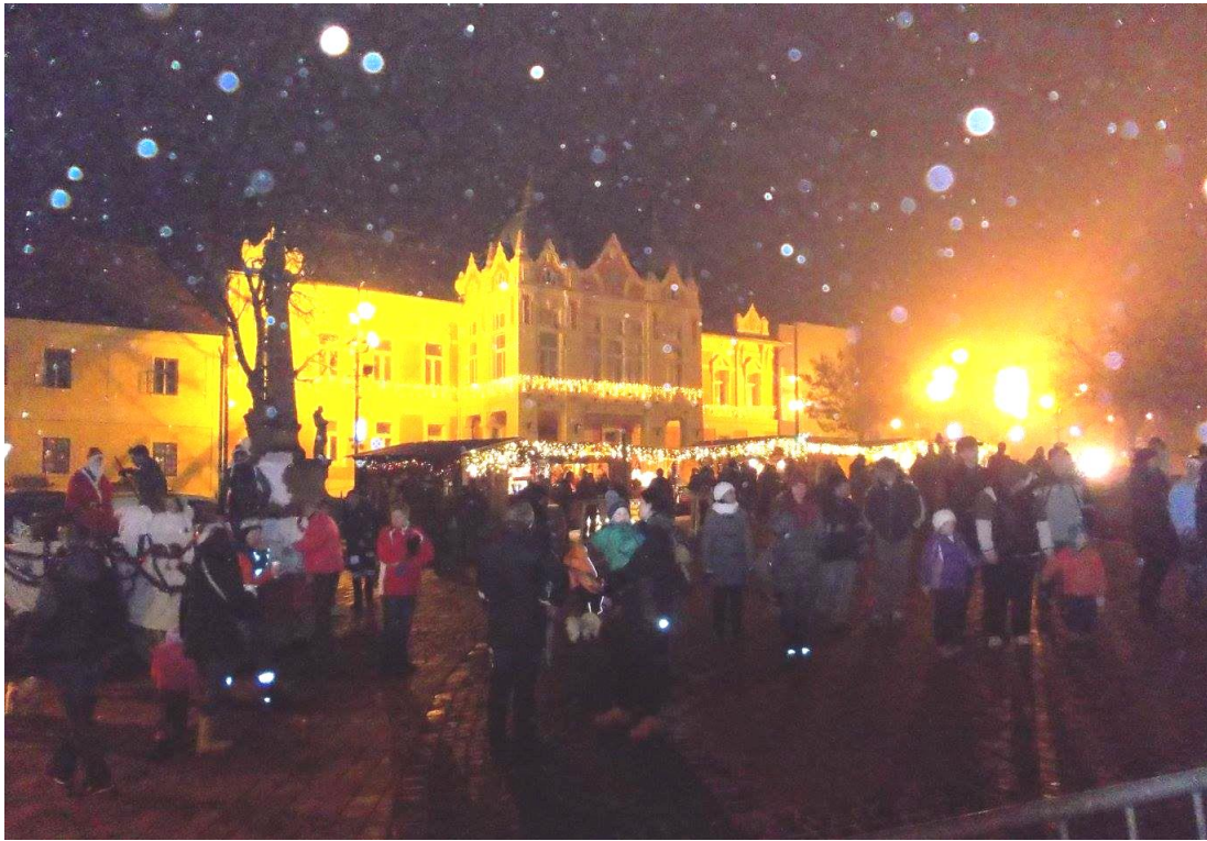
Indul a „Mikulásjárat 2015”