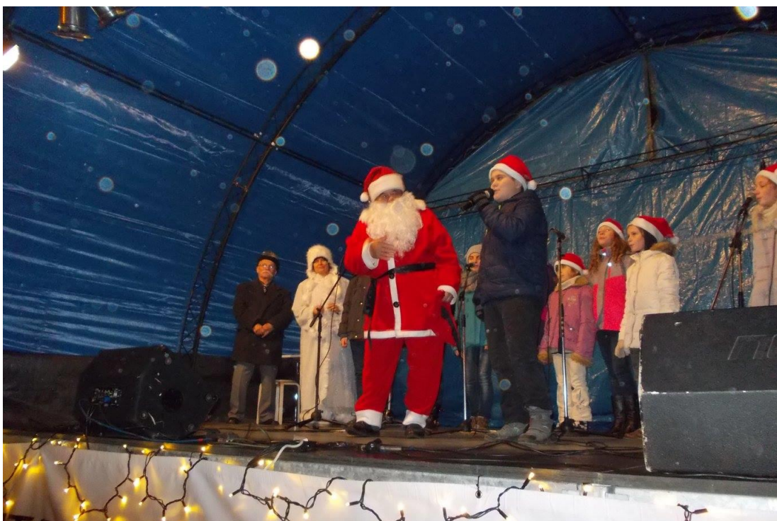
Télapó műsor a Tücsök Zenész Színpad Gyermekcsoportjával