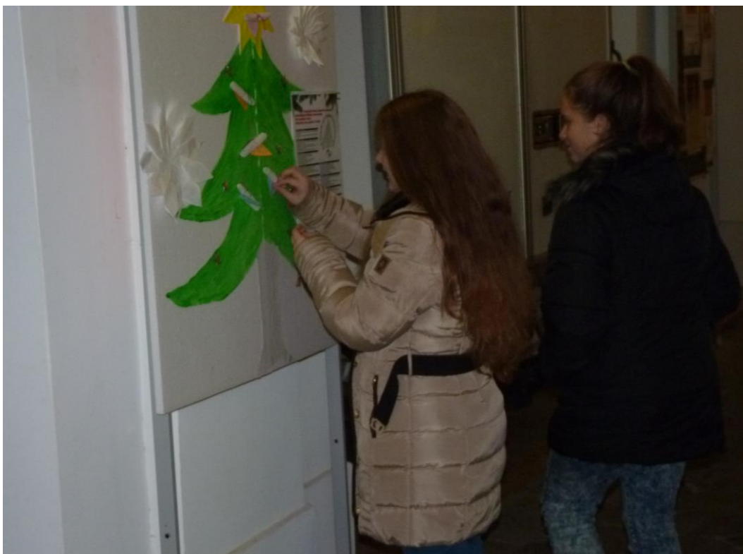
Működik a Karácsonyi Szívküldi – szeretet üzenetek elhelyezése