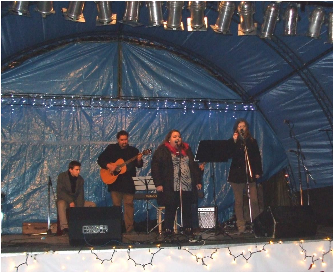
Színpadon az I. Béla Zeneműhely