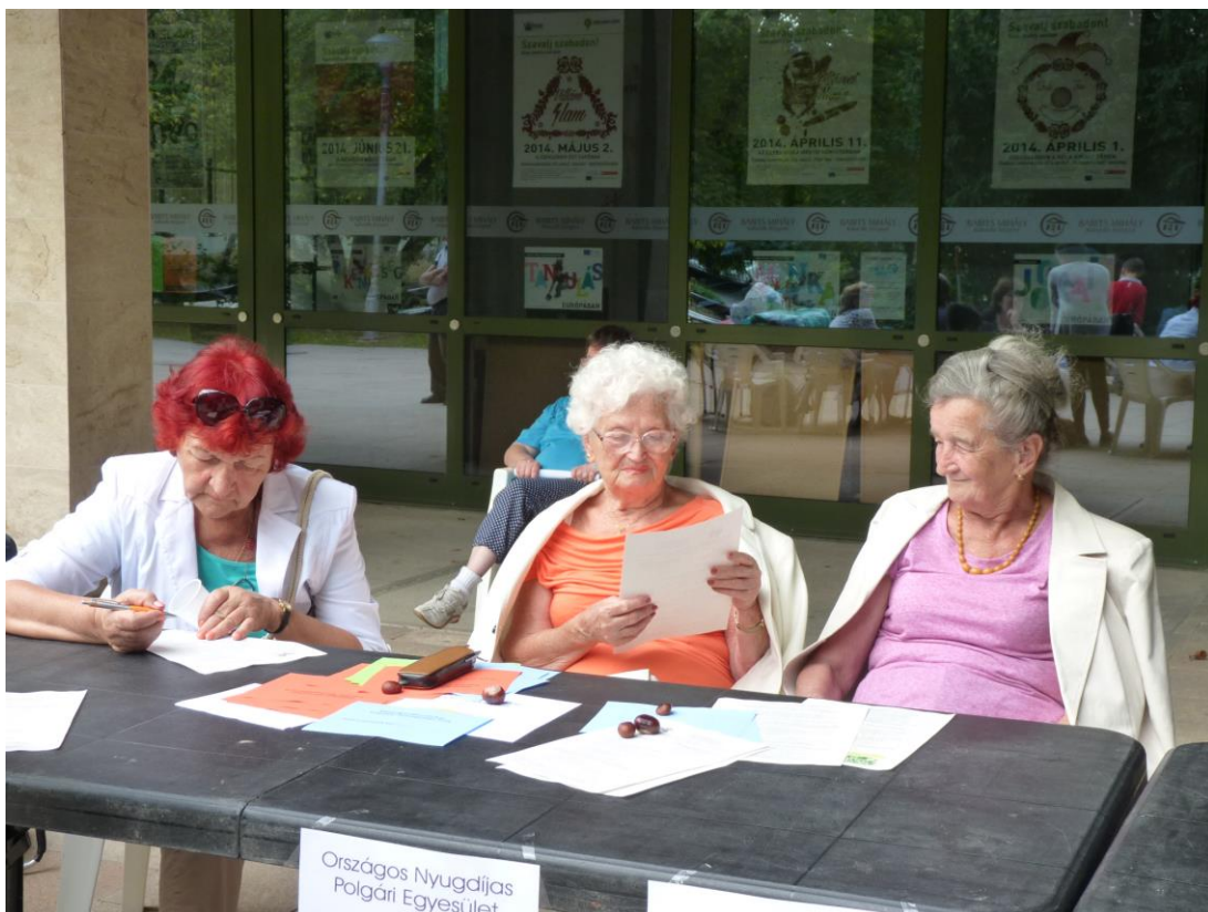
A „Bölcsesség” képviselői az ÁRH szolgálatában