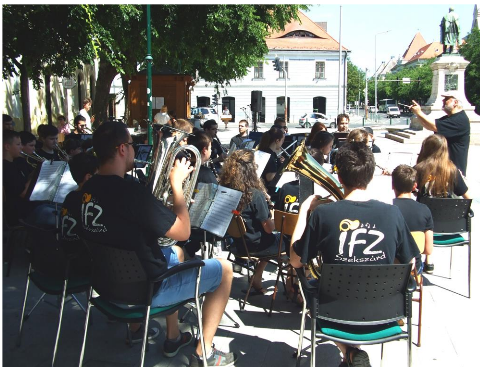
Térzenét ad az Ifjúsági Fúvószenekar