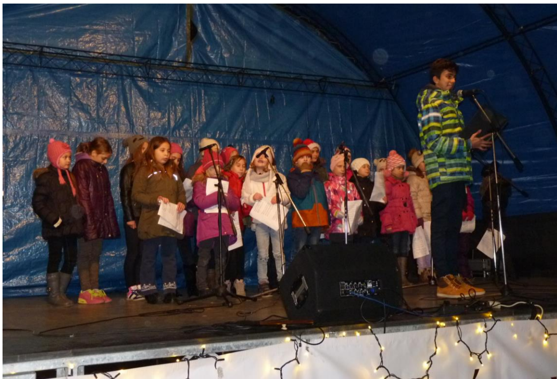
Adventi énekeket és verseket adnak elő a Szekszárdi Dienes Valéria általános Iskola tanulói civiltáj2016