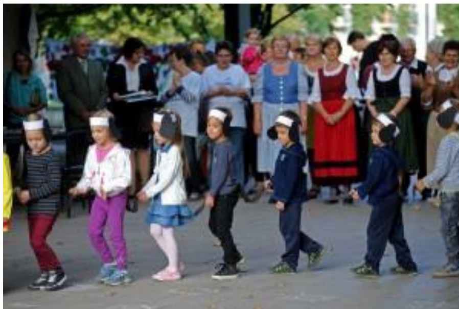
Az ÁRH legapróbb résztvevői (Kadarka utcai Óvoda középsős- nagycsoportosai) köszöntik az év képviselőjét