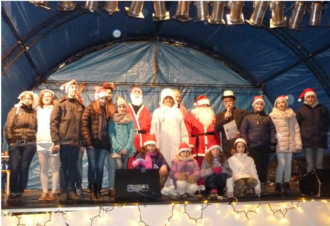
A Mikulás szánja közreműködői