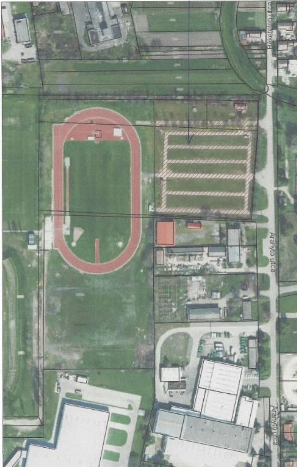
2018.1.19, Szekszárd, M = 1:2000