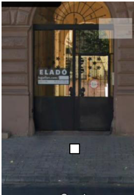
4. Szent István tér 28., 1 botlatókő