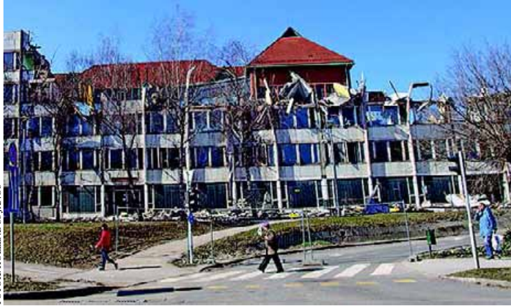
Az erőgépek nyomán lassan eltűnik az épület. A nyugati oldalon (alsó képünk) már csak az egykori szobák maradványai láthatók