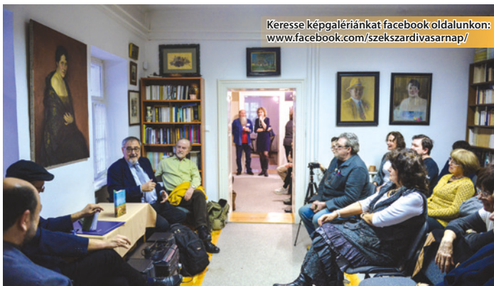
Keresse képgalériánkat facebook oldalunkon: www.facebook.com/szekszardivasarnap/