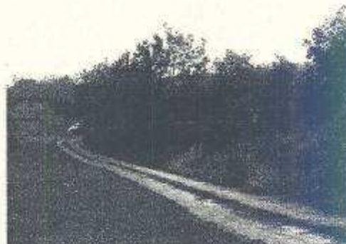
Telekre vezető út