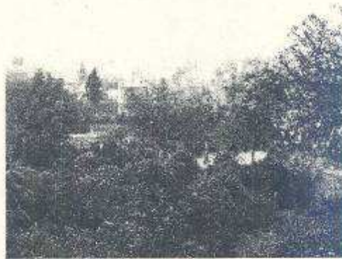
Látkép a telekről